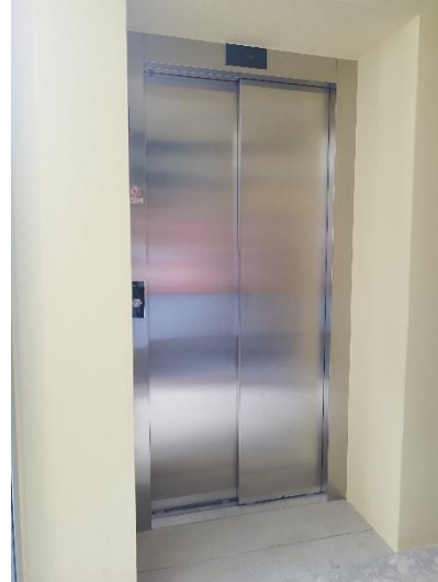
Sliki 1 in 2: Dvigalo v večstanovanjski zgradbi na Makedonski ulici 31