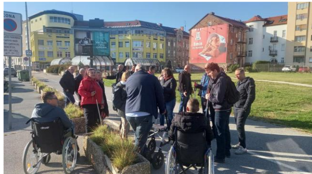
Sliki 9 in 10: Usposabljanja za voznike mestnega potniškega prometa

Drugi pomemben sklop aktivnosti v letu 2025 je bila priprava vsebin o dostopnosti za spletno aplikacijo DANOVA NEXT. V sodelovanju s projektnimi partnerji je potekalo zbiranje, urejanje in strukturiranje informacij o dostopnih storitvah in infrastrukturi na glavni avtobusni postaji Maribor.