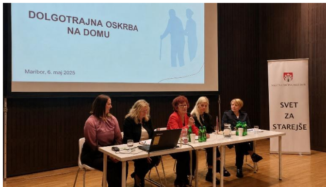
Slika 14: Posvet v Vetrinjskem dvoru