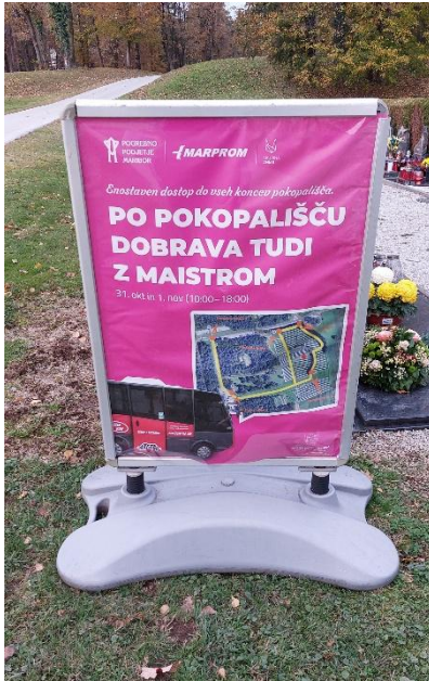
Slika 5: Z Maistrom po Dobravi

prevoza je obiskovalcem omogočila enostaven in učinkovit dostop do različnih delov pokopališča.