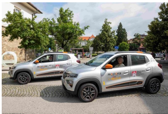
Slika 7: Prostofer

V mesecu oktobru 2025 je podžupan Srečko Vilar pripravil srečanje za prostoferje z namenom izkaza zahvale za njihovo nesebično in družbeno odgovorno delo. Srečanje je bilo namenjeno krepitvi sodelovanja ter prepoznavanju pomena njihovega prispevka k izboljšanju mobilnosti starejših prebivalcev mesta. V okviru srečanja so udeleženci izpostavili ključne izzive, s katerimi se srečujejo pri izvajanju prevozov, ter sodelovali v razpravi o možnih rešitvah. Prostoferji so imeli priložnost izmenjati svoje izkušnje iz prakse, obenem pa podati konkretne predloge za nadaljnje izboljšanje organizacije in izvajanja storitve.