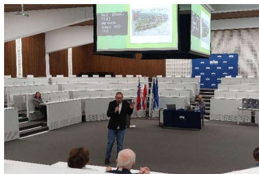
Sliki 12 in 13: Nastopajoči na proslavi in predavanje ob mednarodnem dnevu starejših