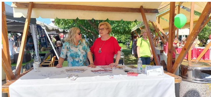
Slika 11: Predstavitev Sveta za starejše ob Dnevu odprtih vrat Doma pod gorco

DCA, kjer je nudil informacije o aktivnostih, ki jih izvajajo v dnevni centrih aktivnosti za starejše. Na dogodku so razdelili številne brošure in drugi informacijski material.