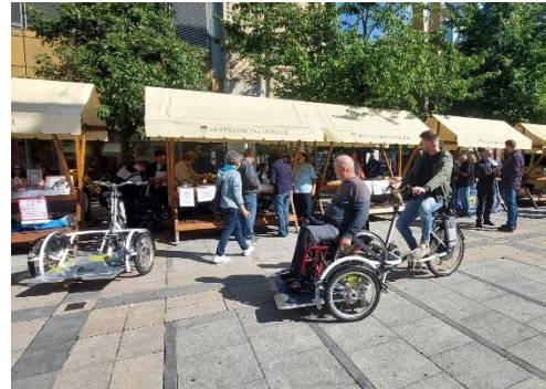
Dogajanje na Trgu Leona Štuklja ob Dnevu mobilnosti invalidov