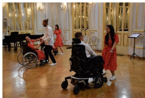
Nastopajoči na Kulturnem večeru invalidov