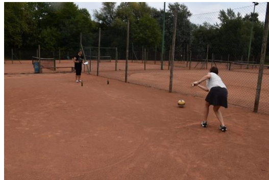
Športno-rekreativno srečanje invalidov Maribora 2025