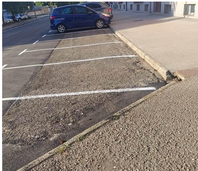
Slika Jug – Sever