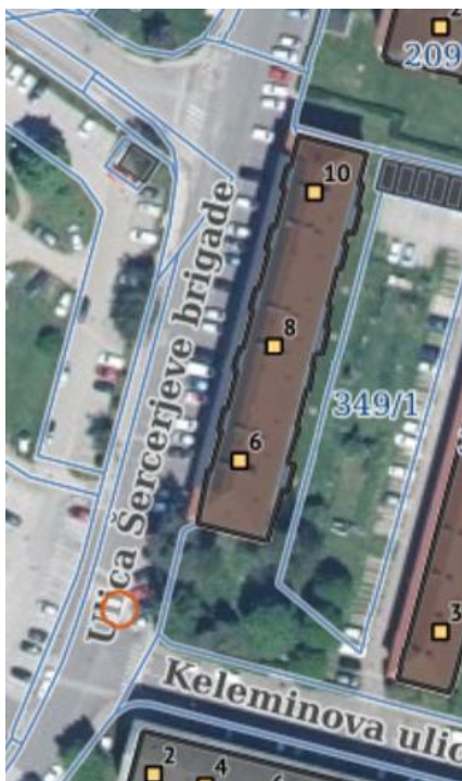
Parcela 2785/1 K.O 614 Tezno v lasti Mom – Občinska cesta

V teku je obnova Šercerjeve ulice v mestni četrti Tezno.