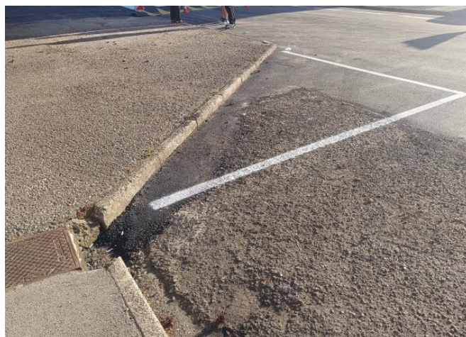
Slika Sever - Jug