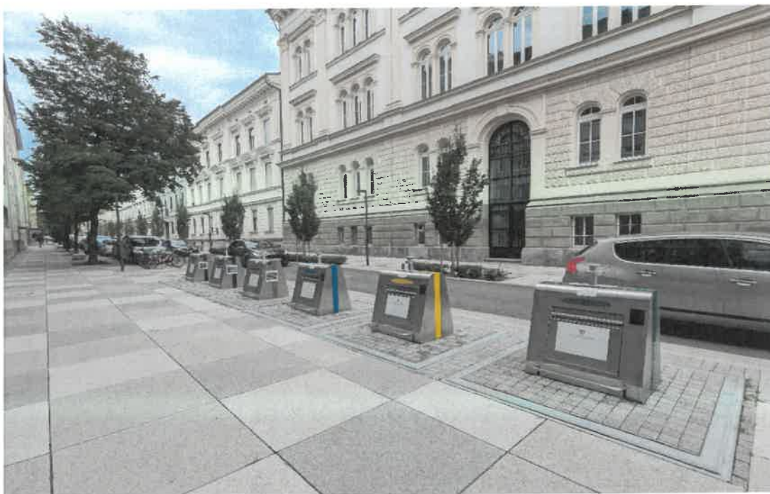
Slika 1: Primer postavitve – Gregorčičeva ulica

Po preverjanju prostorskih možnosti so bile izbrane lokacije na naslednjih območjih: Tkalskega prehoda, Gledališke ulice, Slomškovega trga in Aškerčeve ulice.