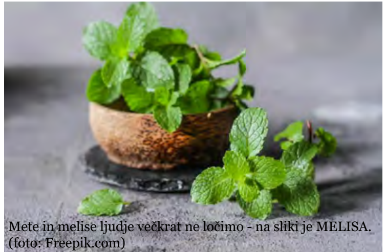
Mete in melise ljudje večkrat ne ločimo - na sliki je MELISA.

Pa se osredotočimo najprej na meliso. Govorimo o navadni melisi, lat. Melisa Officinalis , ki je trajnica, ima vonj po limoni in je aromatičnega okusa. Liste in celo rastlino nabiramo ob sončnem vremenu dopoldne, preden se rastlina razcveti, od maja do septembra. Čimprej jo moramo posušiti v senci, da ohrani lepo zeleno barvo. Melisa pomirja, krepi živce, blaži krče v črevesju, deluje proti napenjanju in ima blagodejen vpliv na srce in možgane. Pomagala naj bi pri premagovanju glavobolov, blažila potovalno slabost in vplivala na hitrejše celjenje ran. Uporabljala naj bi se tudi pri zdravljenju depresije in uravnavala neredno menstruacijo. Z rednim uživanjem melise si krepimo spomin, zmanjša se tesnoba, prav tako pa je rastlina učinkovita pri odpravljanju prehladov in zniževanju prekomerne telesne temperature.