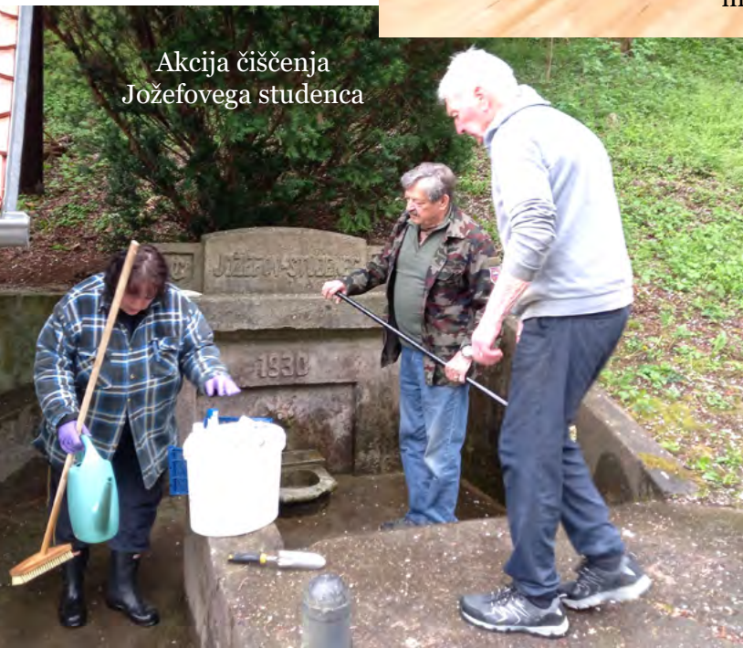
Akcija čiščenja Jožefovega studenca