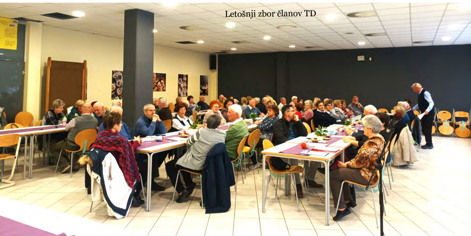
Letošnji zbor članov TD