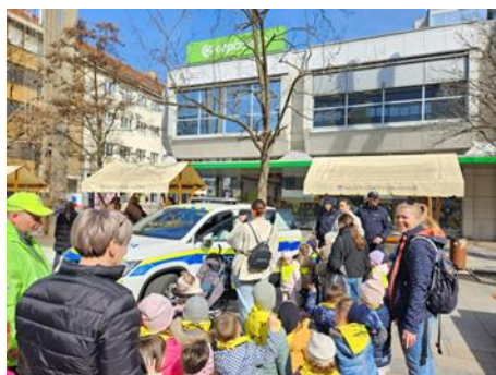
Fotografije: predstavitev dela policista

Na prireditvenem prostoru se je predstavila tudi Služba nujne medicinske pomoči. Otroci so si ogledali reševalno vozilo. Reševalec pa jim je predstavil svoje delo.