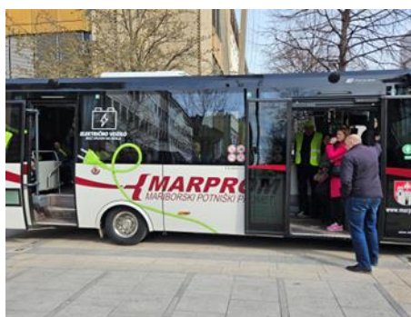
Fotografije: demonstracija varne vožnje z avtobusom