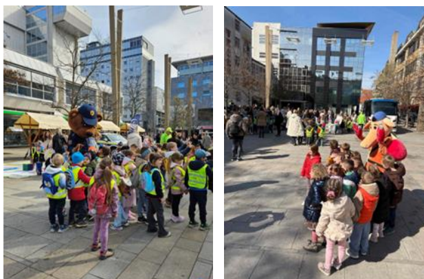
Fotografije: srečanje z maskoto Pasavčka in medvedko Piko

Posebno doživetje za otroke je bilo srečanje z maskoto Pasavček in policist medo Leon ki sta se sprehodila med otroci na prireditvenem prostoru.