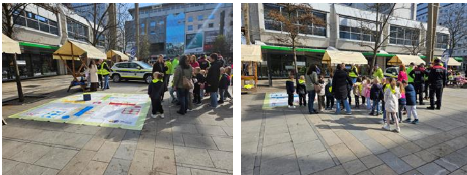
Fotografije: igra »Človek razgibaj se«

Predstavniki NIJZ, OE Maribor so se predstavili z aktivnostjo oz. igro »Človek razgibaj se« " in promocijskim gradivom.