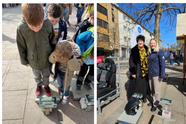
Fotografije: demonstracijska naprava AVP SPV