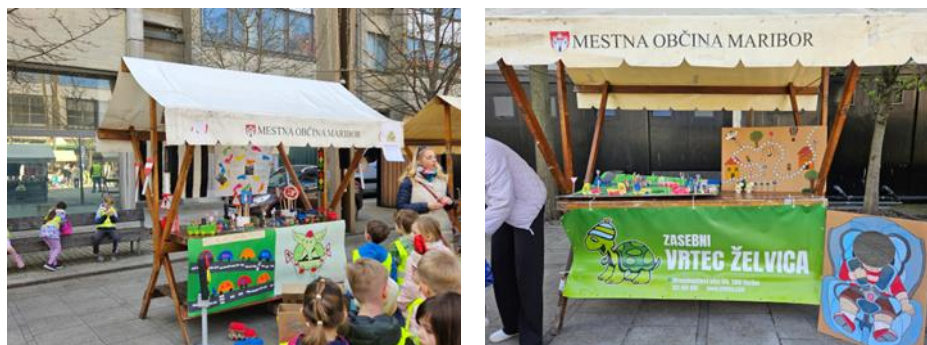
Fotografiji : izdelki otrok vrtca Borisa Pečeta in Želvica

V okviru prireditve Red je vedno pas pripet so potekale številne aktivnosti. Vrtec Borisa Pečeta in vrtec Želvica sta se predstavila z izdelki, ki so jih naredili otroci v okviru projekta.