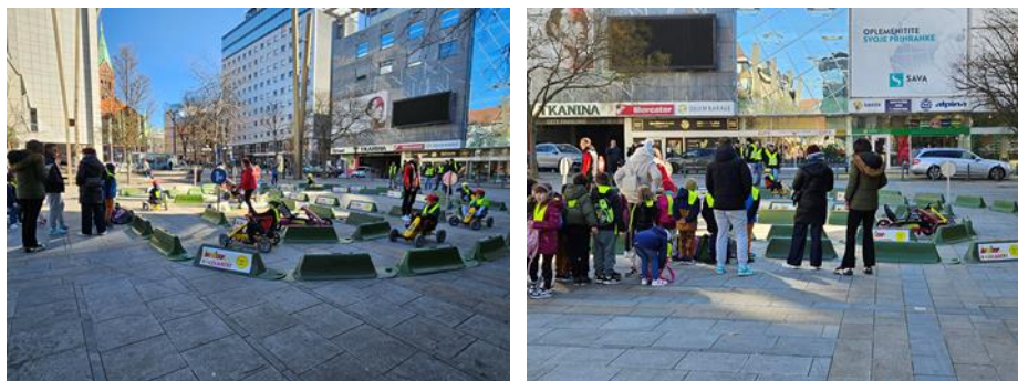
Fotografije: Vožnja otrok na poligonu "Kolesarčki"

V okviru zaključne prireditve so se otroci preizkusili tudi v vožnjo z mini kolesi na poligonu KOLESARČKI.