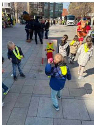
Fotografije: Otroci v ustvarjalni delavnici Zveze prijateljev mladine Maribor

Akciji Red je vedno pas pripet se je pridružilo tudi podjetje javnega potniškega prometa MARPROM z demonstracijo varnega prevoza otrok z avtobusom. Z avtobusom, ki ima vgrajene varnostne pasove so na prireditvev pripeljali skupino otrok in tako demonstrirali varen prevoz otrok z avtobusom. Na prireditvenem prostoru so tudi ostali otroci in njihovi spremljevalci dobili navodila za varen prevoz otrok z avtobusom in za pravilno pripenjanje otrok v avtobusu.