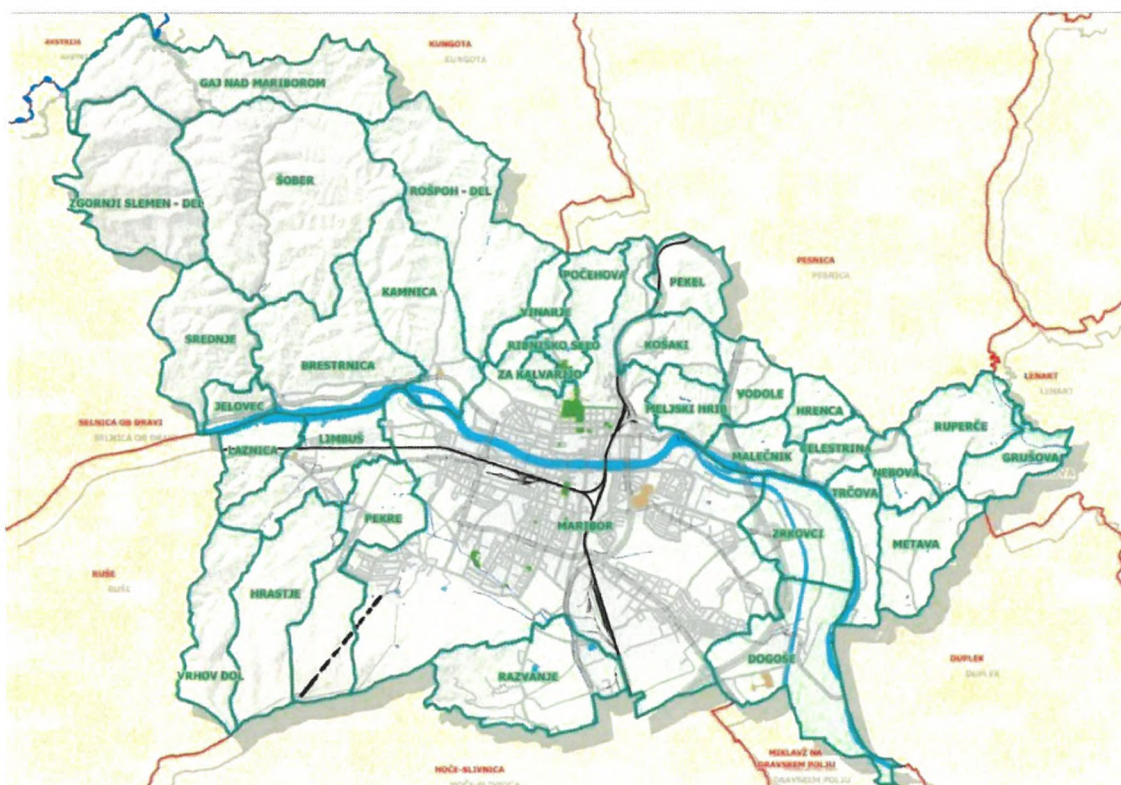
SLIKA 1: Mestna občina Maribor