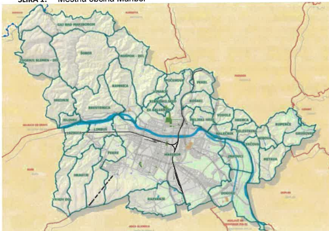
SLIKA 1: Mestna občina Maribor