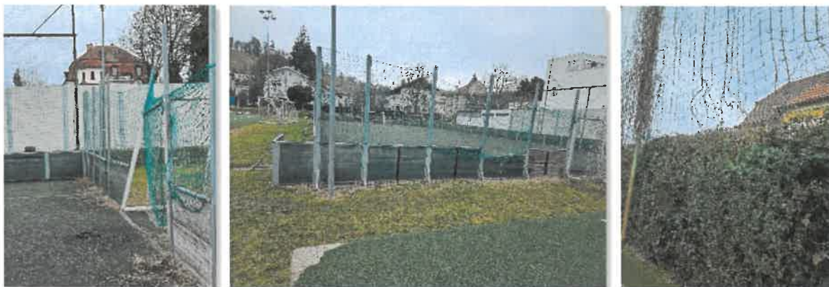
Dotrajano in razmajano ogrodje, raztrgane in poškodovane lovilne mreže

Vir: MO Maribor, Projektna pisarna, februar 2026