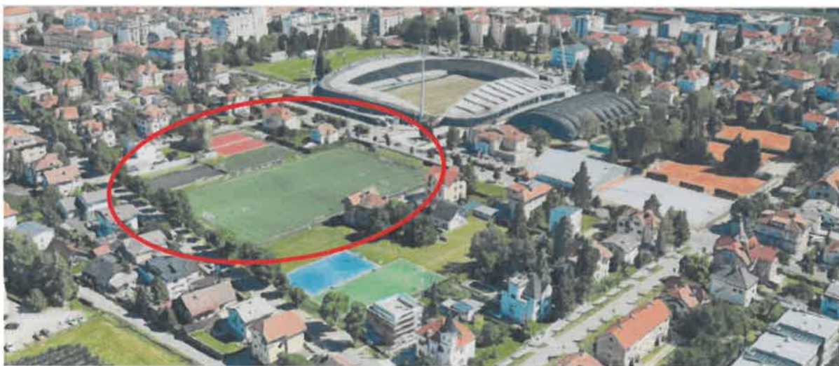
Slika 1: Igrišča Partizan, pogled s severa proti osrednjemu stadionu