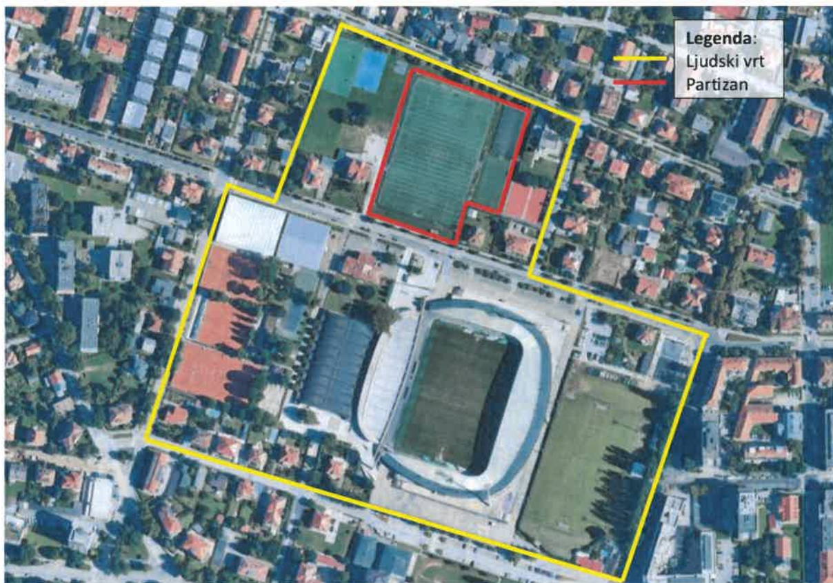
Slika 6: Igrišča Partizan so severni del Nogometnega stadiona Ljudski vrt