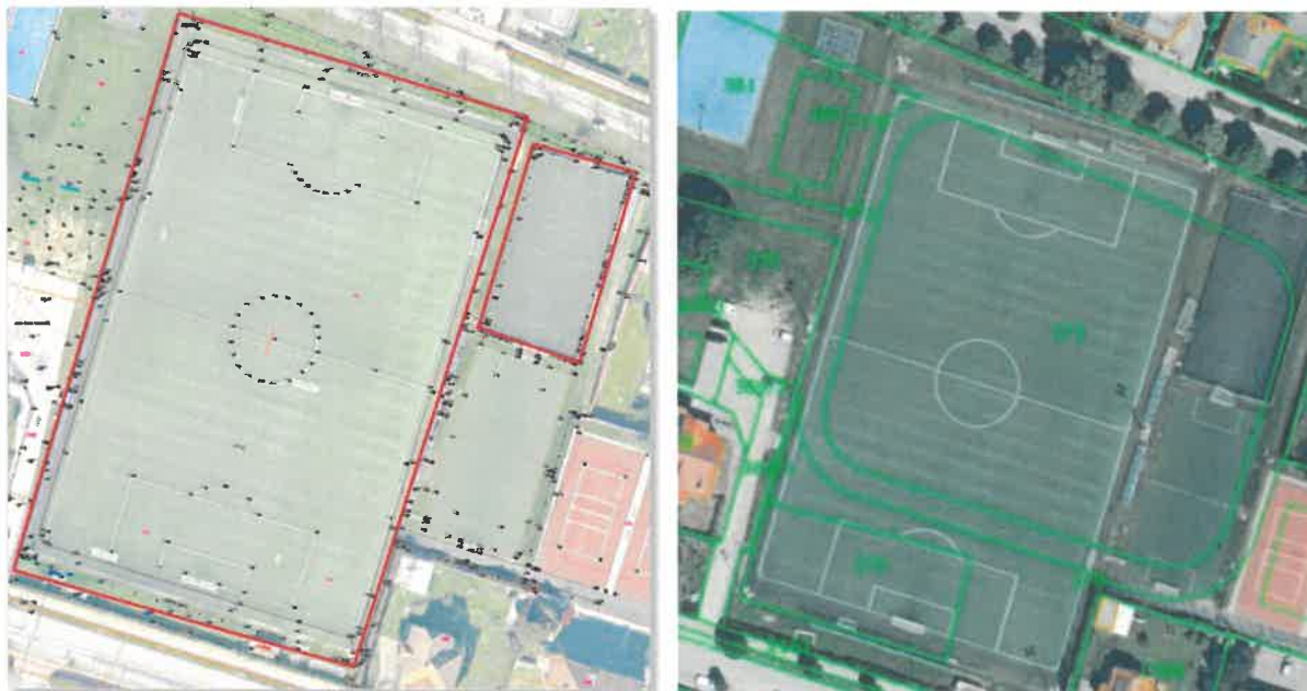
Slika 7: Glavno igrišče in igrišče za mali nogomet Partizan NS Ljudski vrt ter zemljišča

Vira: osnutek PZI, Štajerski inženiring, februar 2026