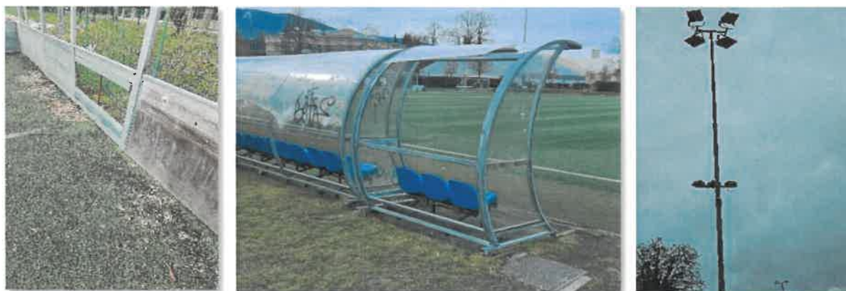
Manjkajoča lesena polnila