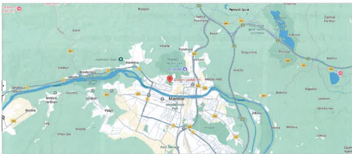
Slika 5: Umeščenost naložbe v mestu Maribor

Načrtovana prenova igrišč Partizan v Ljudskem vrtu v Mariboru bo potekala v regiji Podravje, mestni občini Maribor.