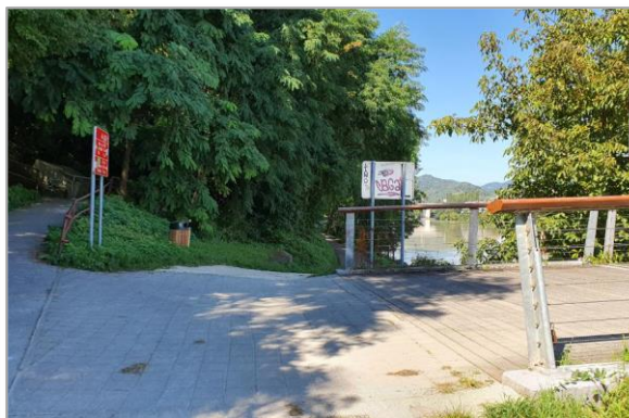
PROINFRA inženirski biro d. o. o.

Trasa načrtovanega pododseka 5 odseka 2 DKP poteka po obstoječi javni neutrjeni vzdrževalni makadamski poti ob Dravi, ki je hkrati sprehajalna pot. Uporabljajo jo pešci in kolesarji. Namenjena pešcem in kolesarjem. Površina poti ni utrjena, prometnih oznak ni. Na levi strani (vzdolž rečnega toka v smeri proti vzhodu) je omejena z brežino reke, na desni strani jo omejujejo 3–5,4 metra visoki ostanki rečnih teras, ki se od Ruške ceste spuščajo k reki.. Brežina reke je zatravljena, strme brežine dravskih teras so porasle večinoma s samoraslimi drevesi, grmovjem in plevelom.