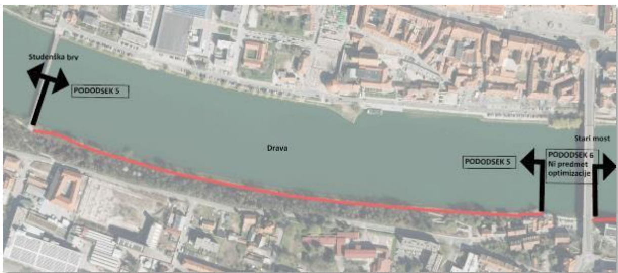
Slika 1: Dravska kolesarska pot, odsek 2, pododsek 5 Studenška–Splavarska brv

Analiza stanja je povzeta iz projektne naloge za izdelavo projektne dokumentacije, ki jo je leta 2019 pripravil investitor, MO Maribor, za celotni odsek 2 10 , projektne naloge za optimizacijo naložbe 11 (v nadaljnjem besedilu: projektna naloga 2024) ter Zbirnega načrta projektne dokumentacije za izgradnjo (PZI) „Novelacija/optimizacija PZI projektne dokumentacije projekta Dravske kolesarske poti: Adamičevo naselje – dvoetažni most (med Splavarsko in Studenško) brvjo, odsek 2, pododsek 5“, št. projekta 2419, ki jo je februarja 2026 po recenziji (december 2025) izdelala družba Megaliti, inženirski biro, d o. o., Poljčane 12 (v nadaljnjem besedilu: PZI). Dokumentacija PZI je izdelana za pododsek 5 odseka 2 DKP in je prikazana na sliki v nadaljevanju: