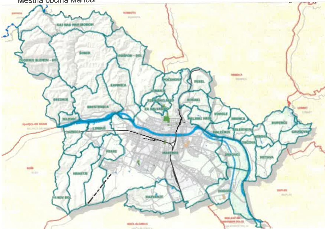
Mestna občina Maribor