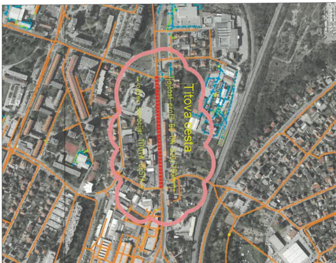
Slika 1: Pregledna situacija odseka Titove ceste, kjer je predvidena sanacija kanalizacijskega omrežja