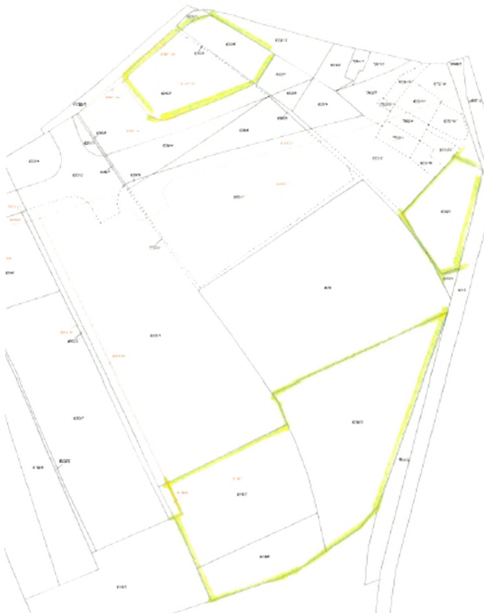
Izsek iz parcelacije, postopek že teče na GURS – prikaz sprememb (novo nastalih parcel).