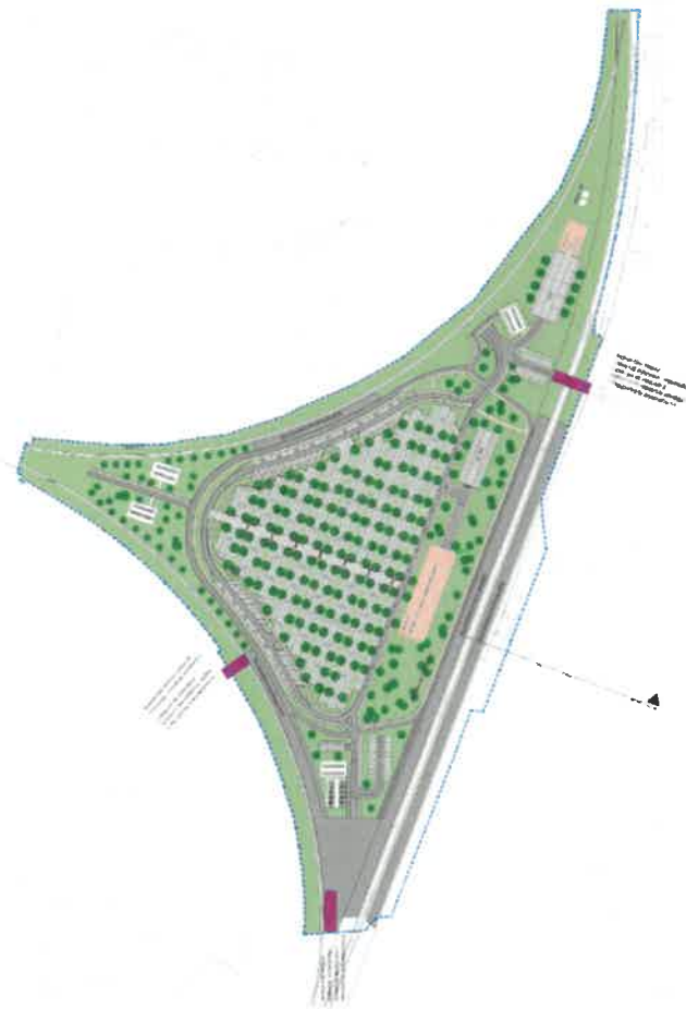
Ureditvena situacija, OPPN za del območja Ta3-C ob glavni železniški progi št. 30 Zidani Most – Šentilj – državna meja (mobilnostno vozlišče na območju železniškega trikotnika) v MOM