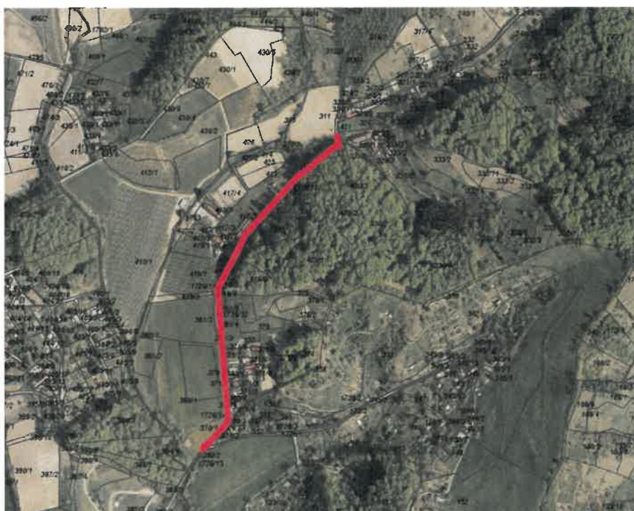
Slika 2: Prikaz predvidenega novega vodovoda

Predvidena investicija zajema izgradnjo vodovoda z namenom zagotavljanja javne oskrbe s pitno vodo objektom v delu naselja Rošpoh, od h. št. 51 do h. št. 61.