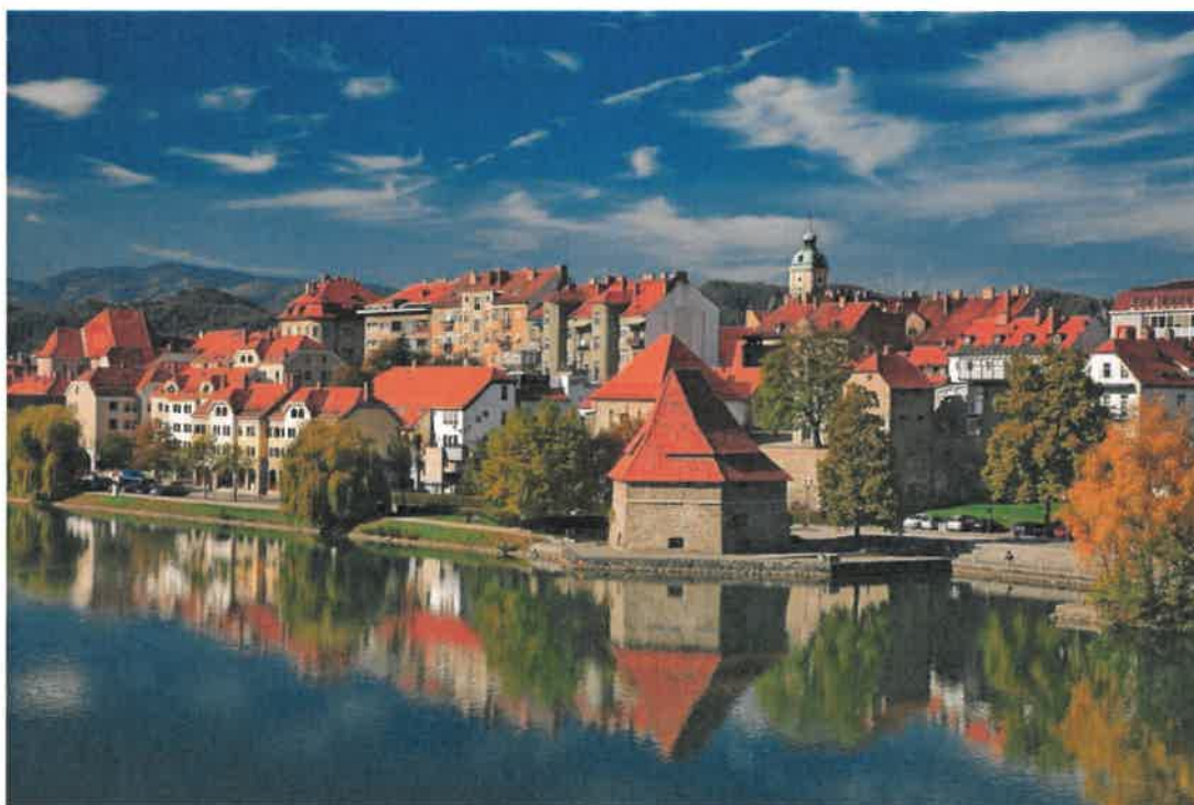
Slika 1 Maribor - Lent

Površina MO Maribor obsega 147 km 2 . V Mestni občini Maribor je na dan 1.1.2025 živel 114.301 prebivalcev 1 .