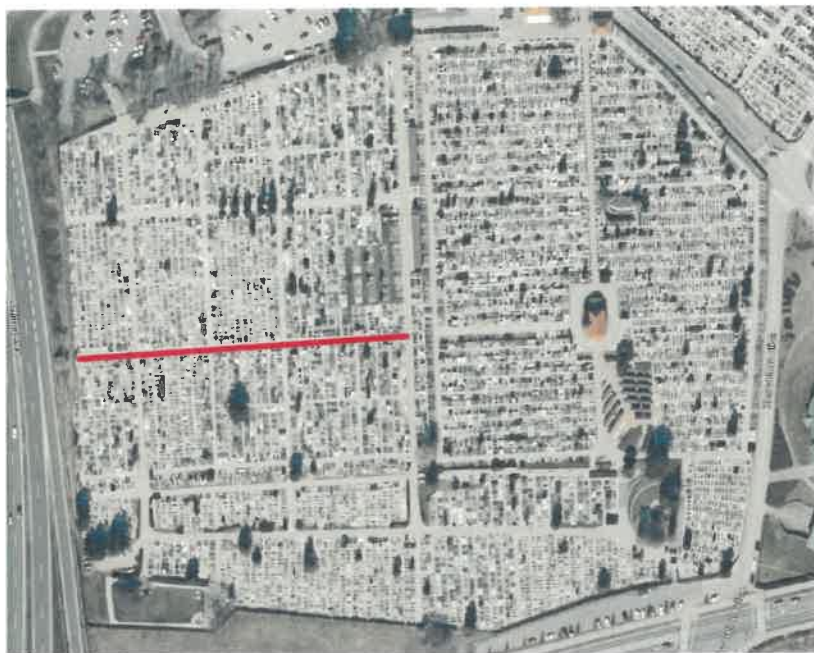
SLIKA 6: Lokacija in velikost območja za širitev pokopališča Dobrava

Vrednost investicije je ocenjena na 243.740,00 EUR brez DDV oziroma, 297.362,80 EUR z DDV v tekočih cenah.