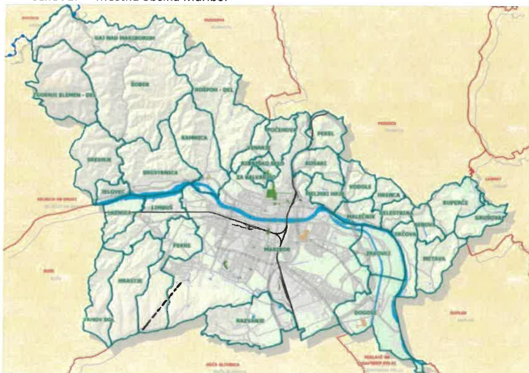
SLIKA 1: Mestna občina Maribor