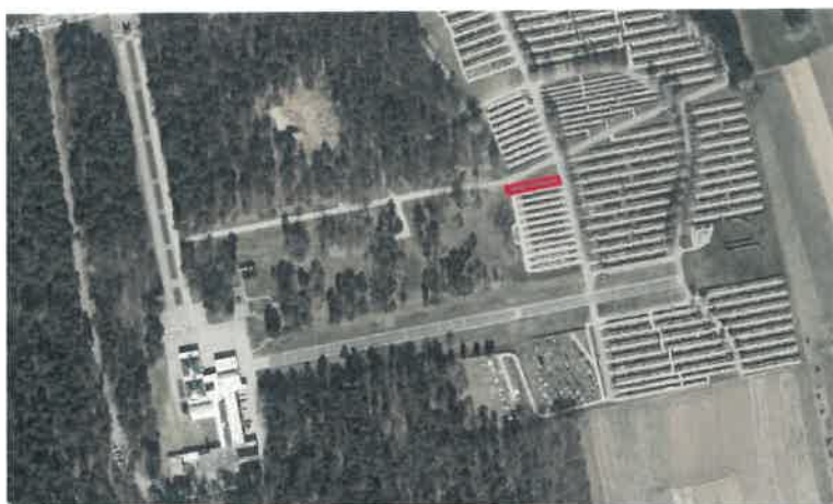
SLIKA 3: Lokacija in velikost območja za širitev žarnih in enotnih grobov pokopališča Dobrava

Ker že zmanjkuje grobnih polj za pokop je potrebno takoj urediti linijo grobnih polj – 22 komadov z vso potrebno infrastrukturo.