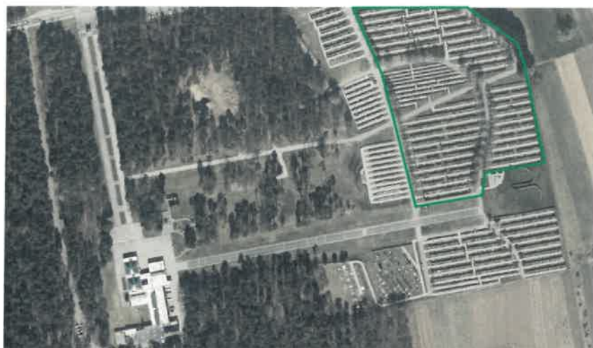
SLIKA 4: Lokacija in velikost območja za zamenjavo grmovnic na pokopališču Dobrava