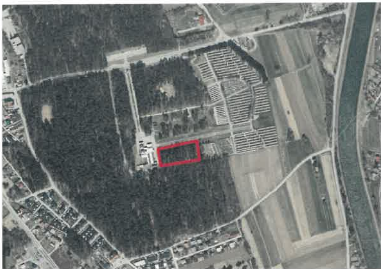
SLIKA 2: Lokacija in velikost območja za širitev pokopališča Dobrava