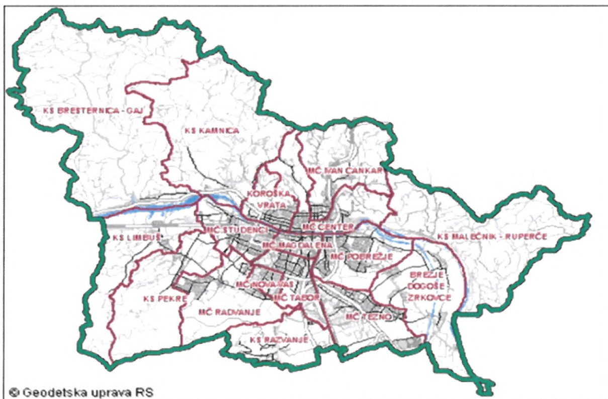
Slika 3: Zemljevid mestnih četrti (MČ) in krajevnih skupnosti (KS) v občini

Teritorialno se občina deli na 11 mestnih četrti in 6 krajevnih skupnosti v okolici mesta, ki spadajo v mestno občino. Občina obsega 33 naselij: Bresternica, Celestrina, Dogoše, Gaj nad Mariborom, Grušova, Hrastje, Hrenca, Jelovec, Kamnica, Košaki, Laznica, Limbuš, Malečnik, Maribor, Meljski hrib, Metava, Nebova, Pekel, Pekre, Počehova, Razvanje, Ribniško selo, Rošpoh-del, Ruperče, Srednje, Šober, Trčova, Vinarje, Vodole, Vrhov dol, Za Kalvarijo, Zgornji Slemen-del in Zrkovci.