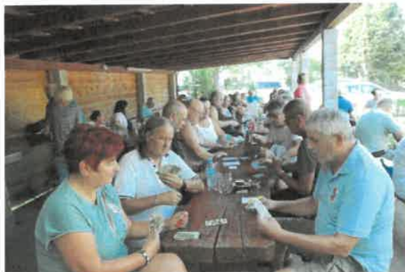
Priloga 6: Poročilo o športno-rekreativnem srečanju invalidov 2024