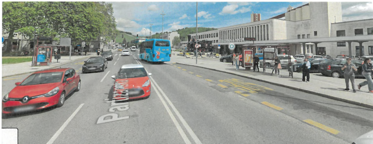
Slika 8: Območje zamenjave avtobusnih nadstrešnic z zelenimi nadstrešnicami (avtobusni postajališči ŽP Maribor)

V sklopu ozelenitve mestnega jedra bosta na postajališču Železniška postaja Maribor vzpostavljeni 2 zeleni nadstrešnici. 1 zelena nadstrešnica bo vzpostavljena na postajališču ŽP Maribor iz smeri mesta, ena nadstrešnica pa v smeri mesta. Investicija vključuje tudi gradbena dela.