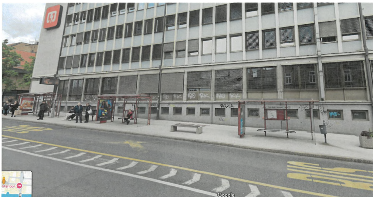
Slika 2: Območje zamenjave avtobusnih nadstrešnic z zelenimi nadstrešnicami (avtobusno postajališče Glavni trg – Elektro)

V sklopu ozelenitve mestnega jedra bosta na postajališču Glavni trg Elektro (Ulica Kneza Koclja) vzpostavljeni dve zeleni nadstrešnici. Nadstrešnici bosta vzpostavljeni na postajališču Glavni trg – Elektro iz smeri mesta. Investicija vključuje tudi gradbena dela.