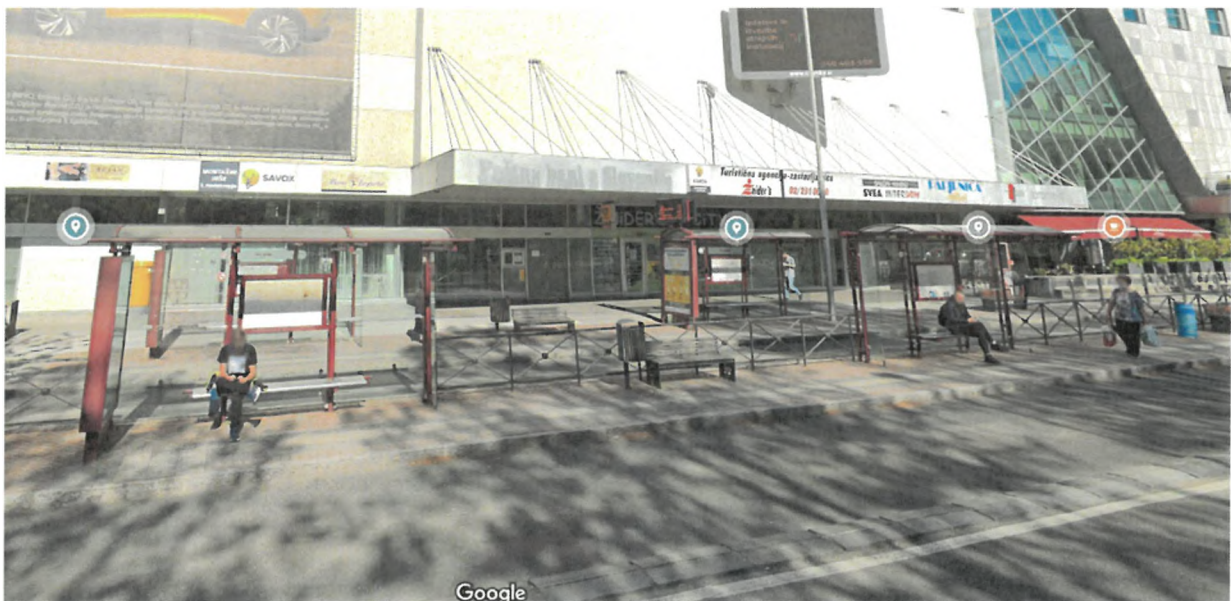
Slika 5: Območje zamenjave avtobusnih nadstrešnic z zelenimi nadstrešnicami (avtobusno postajališče City – Zdravstveni dom – v smeri iz mesta)

V sklopu ozelenitve mestnega jedra bo na postajališču City – Zdravstveni dom vzpostavljenih 5 zelenih nadstrešnic. 4 zelene nadstrešnice bodo vzpostavljene na postajališču Glavni trg – Elektro iz smeri mesta, ena nadstrešnica pa v smeri mesta. Investicija vključuje tudi gradbena dela.