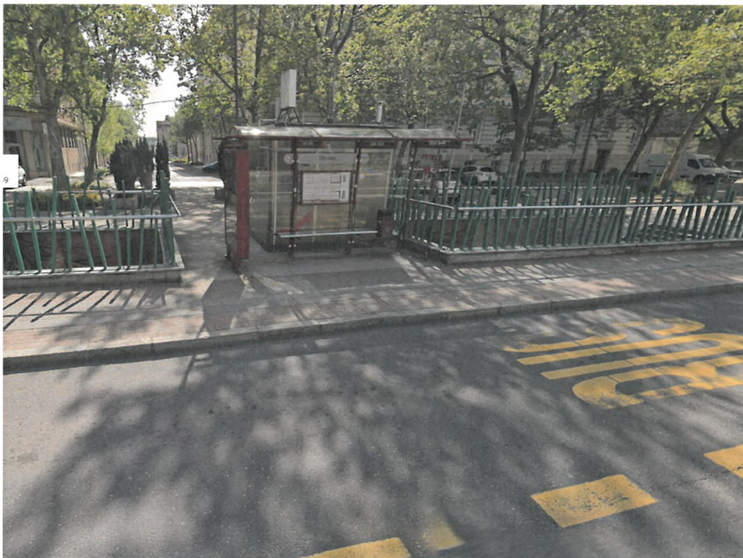
Slika 6: Območje zamenjave avtobusnih nadstrešnic z zelenimi nadstrešnicami (avtobusno postajališče City – Zdravstveni dom – v smeri mesta)