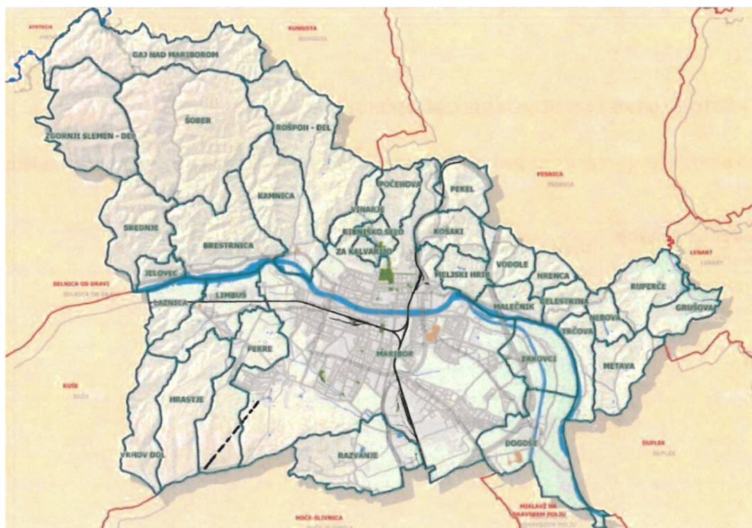
Slika 1: Mestna občina Maribor

Površina Mestne občine Maribor znaša (MOM) znaša 147,5 km 2 in je imela 1.1.2017 111.079 prebivalcev oziroma 753 prebivalca na km 2 (Vir: SURS). Mestno občino Maribor sestavlja 33 naselij: Bresternica, Celestrina, Dogoše, Gaj nad Mariborom, Grušova, Hrastje, Hrenca, Jelovec, Kamnica, Košaki, Laznica, Limbuš, Malečnik, Maribor, Meljski Hrib, Metava, Nebova, Pekel, Pekre, Počehova, Razvanje, Ribniško selo, Rošpoh - del, Ruperče, Srednje, Šober, Trčova, Vinarje, Vodole, Vrhov Dol, Za Kalvarijo, Zgornji Slemen - del, Zrkovci, Brezje.