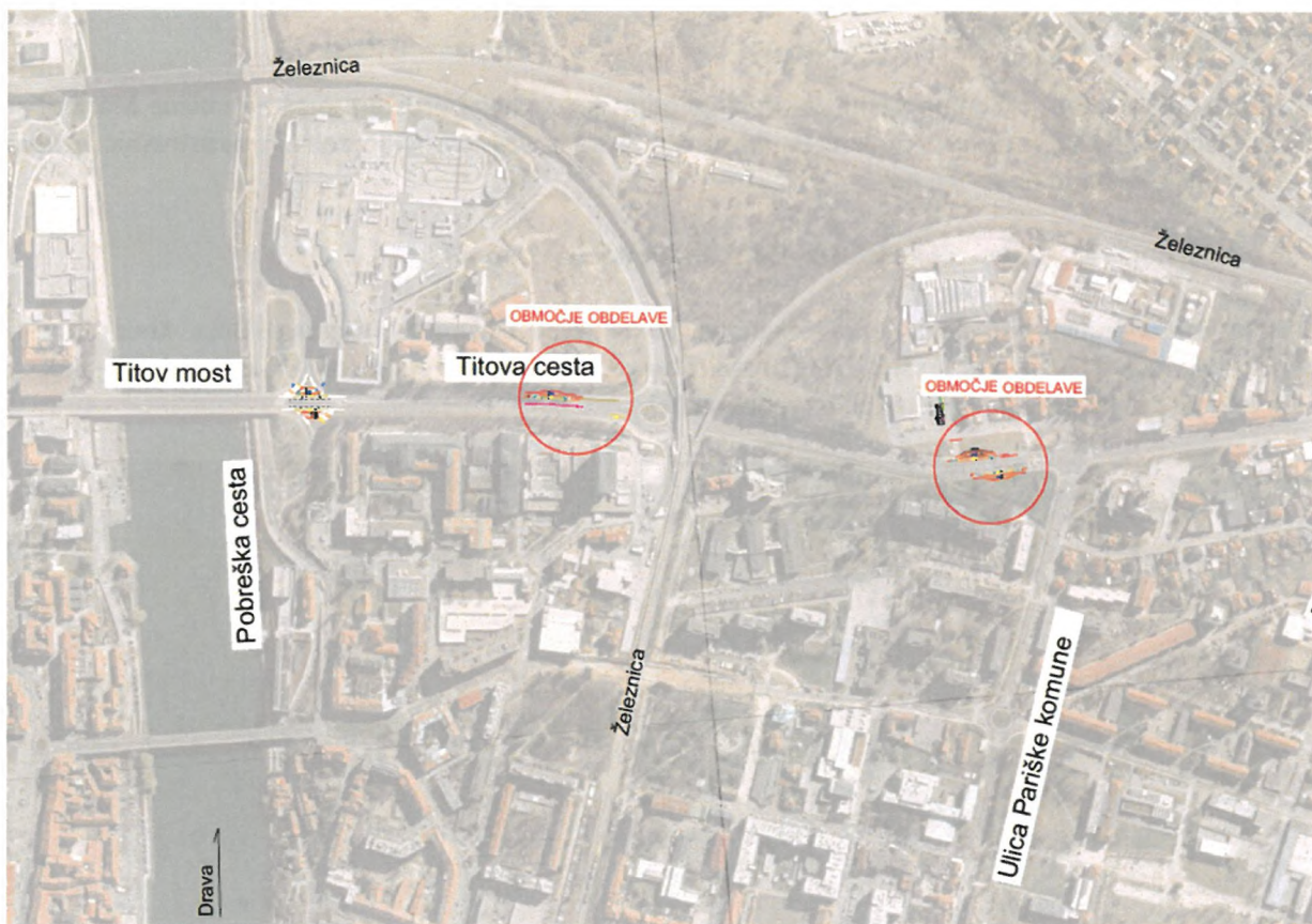
Slika 3: Območje obdelave na Titovi cesti