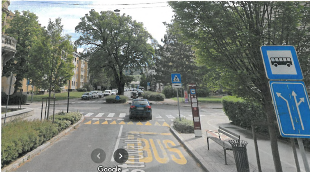
Slika 9: Območje zamenjave avtobusnih nadstrešnic z zelenimi nadstrešnicami (avtobusno postajališče OŠ Franca Rozmana Staneta)