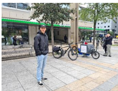
Fotografije: sodelovanje policistov, redarjev in reševalcev, MKM