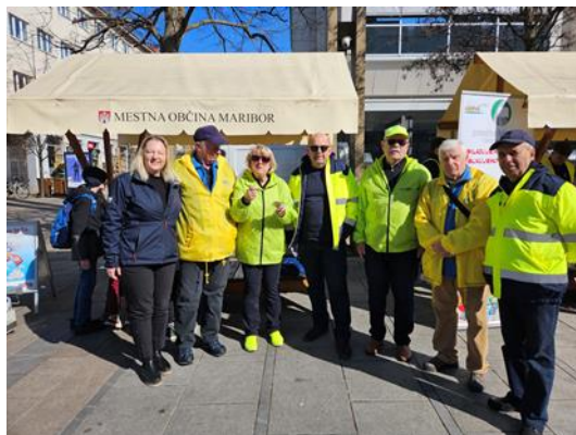
Fotografije: zaključna prireditev RED JE VEDNO PAS PRIPET