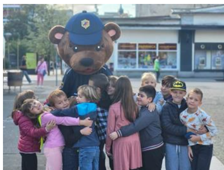
Fotografije: vzgojno preventivni dogodek ob Tednu prometne varnosti