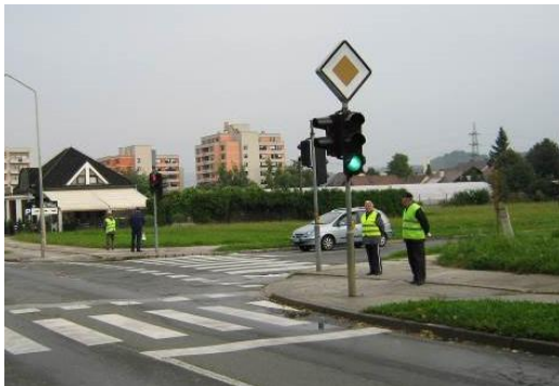
Fotografiji: vzgojno preventivna akcija VAROVANJE OTROK NA ŠOLSKI POTI

Maribor. Poleg naštetih aktivnosti Sveta za preventivo in vzgojo v cestnem prometu za zagotavljanje varnosti otrok na šolskih poteh je bilo izvedenih tudi nekaj ukrepov v okviru realizacije komunalnih – cestnih programov, ki posredno zagotavljajo boljšo prometno varnost. Za večjo varnost udeležencev v cestnem prometu so bili v okviru planiranih in razpoložljivih finančnih sredstev izvedeni ukrepi umirjanja prometa in ukrepi za izboljšanje varnosti udeležencev v prometu.