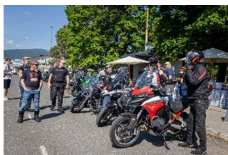
Fotografije: vzgojno preventivna akcija MARIBORSKI MOTO DAN