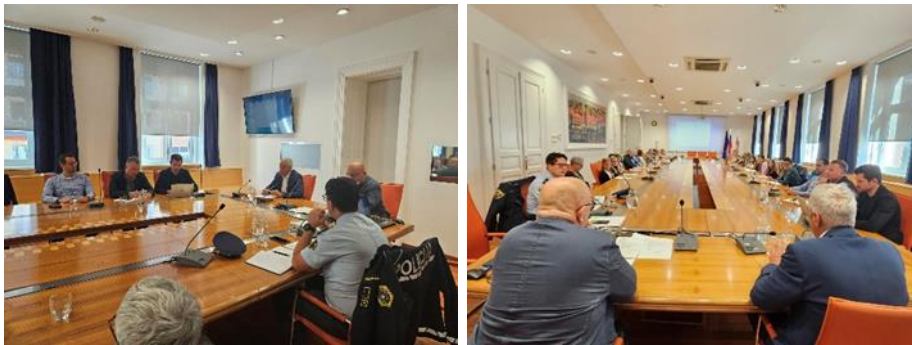
Fotografiji: Okrogla miza "VARNO NA POTI V ŠOLO"

V nadaljevanju so besedo dobili učenci osnovnih šol. Zelo nazorno so predstavili in podali predloge za ureditev šolskih poti. Spregovorili so o razlogih, da se v šolo odpravijo peš, s kolesom ali javnim prevozom. Učenci, predstavniki osnovnih šol, so podali svoja razmišljanja in razmišljanja svojih vrstnikov o tem, kako varne se počutijo na poti v šolo. Opozorili so na pomanjkljivosti prometne ureditve v okolici šol ter podali zahteve za njihovo odpravo. Otroci naj bi v šolo prihajali po urejenih prometnih poteh, kar bi prepričalo tudi starše, da je njihov otrok varen, kadar se v šolo ali iz nje odpravi sam. V okolici šole pričakujejo urejene prehode za pešce, kolesarske poti. Predstavniki posameznih šol so še vedno izpostavili problem hitrosti in podali pobudo za umiritev hitrosti v okolici šol.