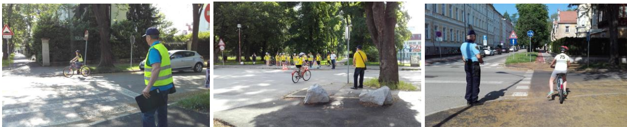
Fotografije: praktični del kolesarskega izpita