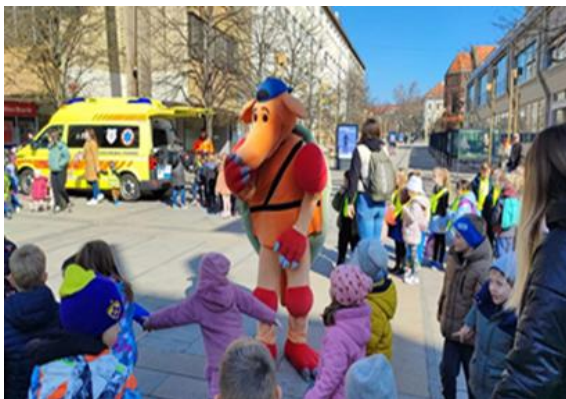
Fotografiji: izvajanje projekta "Pasavček" v vrtcih in šolah