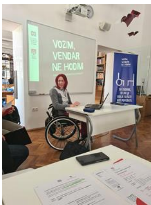
Fotografije: delavnica "Še vedno vozim – vendar ne hodim" v srednjih šolah"

Do konca leta 2024 je bilo izvedenih 12 delavnic v katerih je sodelovalo 766 dijakov in 1. delavnica v kareti je sodelovalo 30 osnovnošolcev.