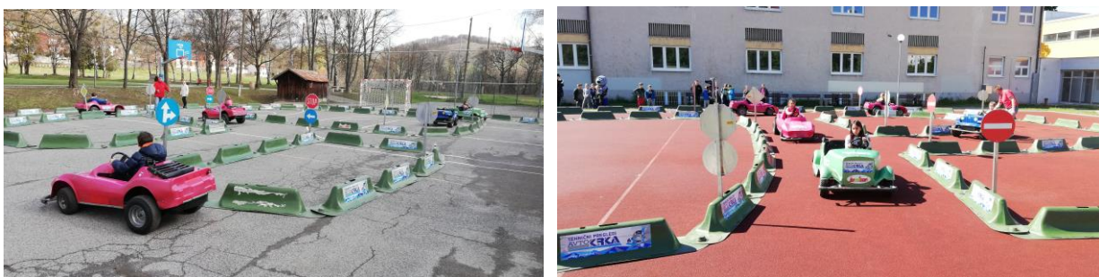
Fotografije: Izvedba programa JUMICAR

Programa JUMICAR in KOLESARČKI otrokom na zabaven, pa vendar poučen način, preko igre predstavi pravilno vedenje v prometnem okolju. Program JUMICAR je namenjen otrokom prvega in drugega izobraževalnega obdobja. Otroci so postavljeni v vlogo voznika in doživljajo dogodke, kot jih opaža in zaznava voznik v prometu. Otroci na poligonu JUMICAR, ki je opremljen s kompletno prometno signalizacijo, v pravih malih avtomobilčkih praktično, na malo drugačen način skozi igro, doživijo pravi svet prometa. S programom JUMICAR pridobijo otroci potrebno znanje o prometu. V šolskem letu 2023/24 je program potekal na 2 OŠ. V program je bilo vključenih 50 otrok.