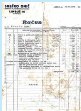
Eden prvih računov, 1949