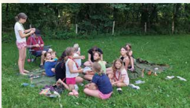
Tabor v Podbeli

Taborništvo pa je seveda mnogo več kot le dejavnost skozi leto. Da pa bi še bolje razumeli, kaj vse pomeni, biti del našega društva, so naši člani delili svoje izkušnje in vtise o tem, kako jih taborništvo navdihuje in povezuje. Preberite, kaj o tem pravijo tisti, ki živijo taborniško vsakdan: