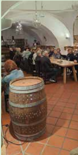
8. marec v Račkem gradu

Kljub nespodbudnemu začetku smo lahko z izvedenim in z udeležbo zadovoljni. Nasvidenje na naših izletih in pohodih tudi v letu 2025.