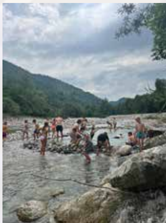
kopanje v Nadiži