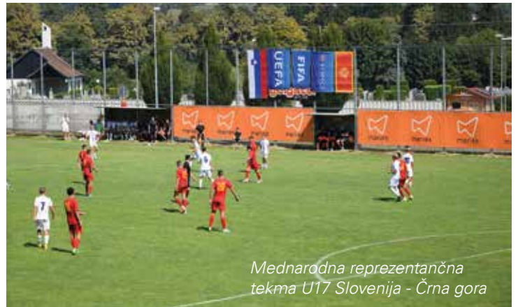
Mednarodna reprezentančna tekma U17 Slovenija - Črna gora

V kolikor bo množičnost še naprej naraščala, bomo lažje vzpostavili selekcijski proces in posledično zvišali naše tekmovalne cilje. V klubu deluje 10 trenerjev s potrebnimi licencami, pretežno iz domače sredine, ki se trudijo iz naših selekcij izveči največ seveda v športnem duhu. Brez kakovostnih trenerjev ni napredka, zato vključujemo v šolanje vsako leto kateriga od naših bivših ali sedanjih članskih igralcev.