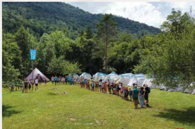
Tabor ob Nadiži