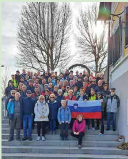
Kulturni dan na Maistrovem Zavrhu