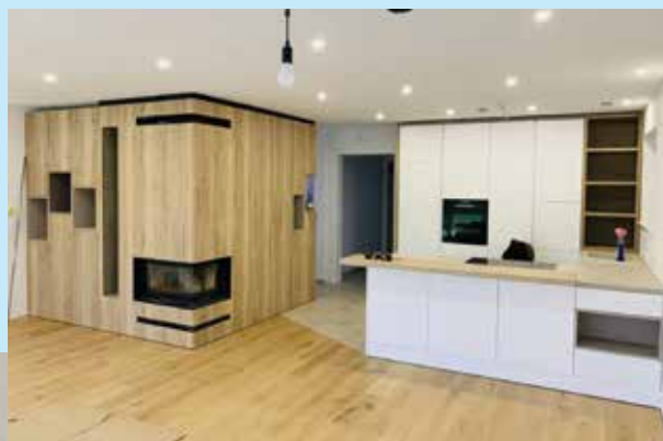
Vedno kaj posebnega ...