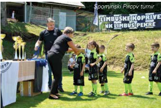
Spominski Pircov turnir