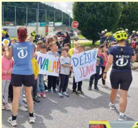
Tako smo pričakali ekipo

Po nekajminutnem predahu in fotografiranju z učenci je ekipa nadaljevala pot proti Mariboru in čez nekaj dni tudi uspešno zaključila naporno, a navdihujočo popotovanje že petnajsto leto zapored.