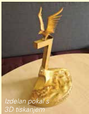
Izdelan pokal s 3D tiskanjem

Izmed več kot 1700 pri- spelih risbic je strokovna komisija, v kateri je sodelo- val tudi Cene Prevc, izbrala zmagovalno risbico z naslo- vom »Zmagovalec 7«, ki