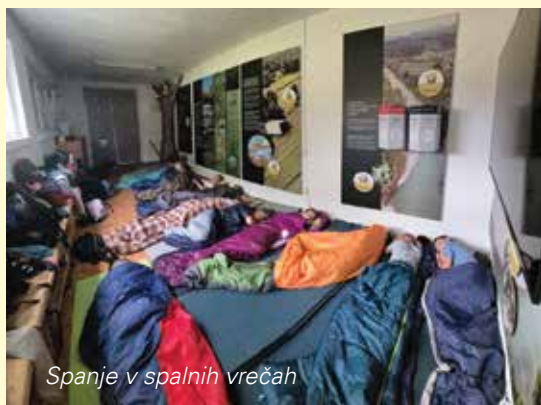
Spanje v spalnih vrečah