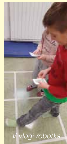
V vlogi robotka

žem zraku in se zelo zabavali. Otroci so bili različno spretni, mnogim je uspelo odkodirati celotno sporočilo, ki je bilo zapisano v obliki povedi. Na šolski hodnik smo nalepili različne mreže, ki so bile podlaga za igro »Kaj če bi se malo umaknil«. Pri tej igri so morali razmisliti