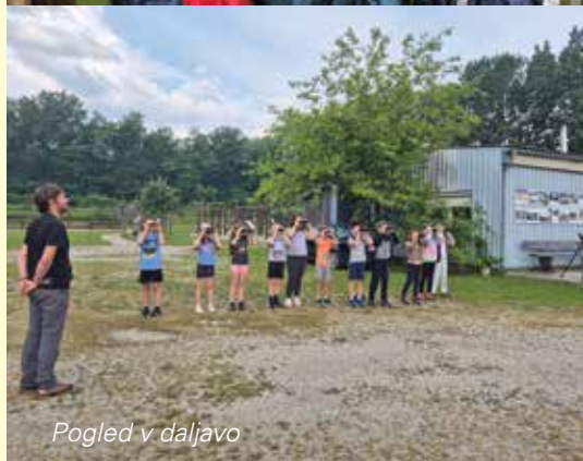
Pogled v daljavo

pri tem pa skrbno pazijo, da živali ne poškodujejo. Ta preprost stik z naravo jim pokaže, kako pomembno je biti nežen in previden pri ravnanju z živimi bitji. Takšna izkušnja ima dolgoročen vpliv. Če že od mladih let razumejo živali kot čuteča bitja, ker jih tako obravnavajo in k temu spodbujajo tudi učitelji, lahko upamo, da bodo skrb za naravo prenesli tudi na prihodnje generacije.