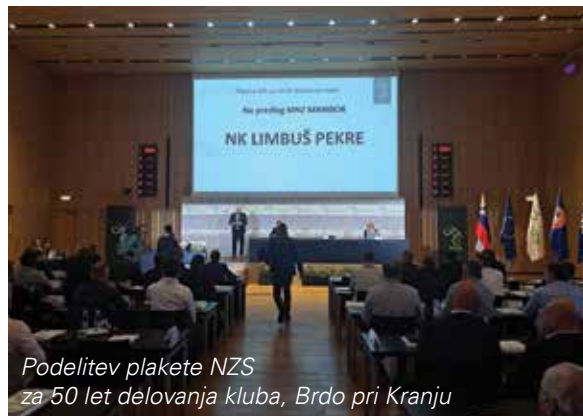
Podelitev plakete NZS za 50 let delovanja kluba, Brdo pri Kranju

Preglavice so delali nalivi, ki so močnejši kot včasih, zato smo se morali ukvarjati s čiščenjem in popravilom drenaže ob igrišču. Nagajali so nam tudi