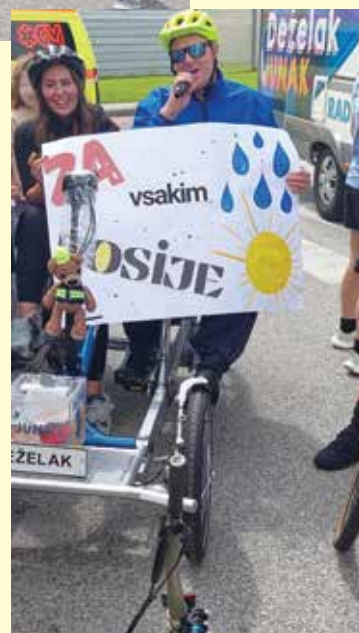
Naš plakat je nato krasil kombi