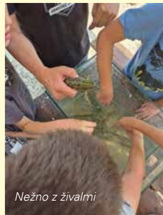
Nežno z živalmi