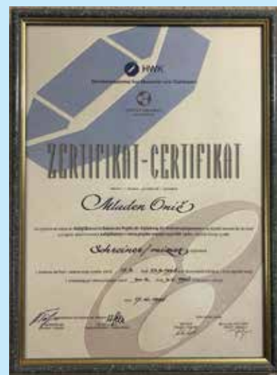
Certifikat za uvajanje mojstrskih izpitov