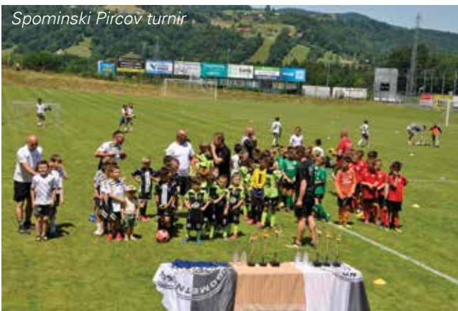
Spominski Pircov turnir