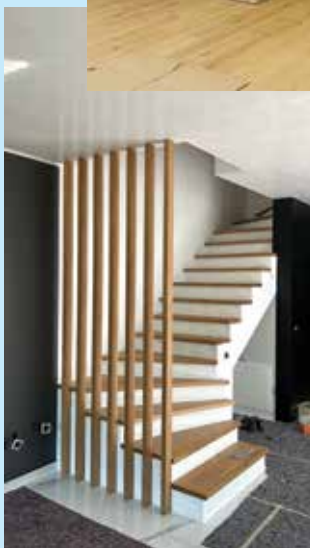
Iz naše delavnice