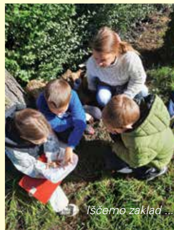
Iščemo zaklad ...