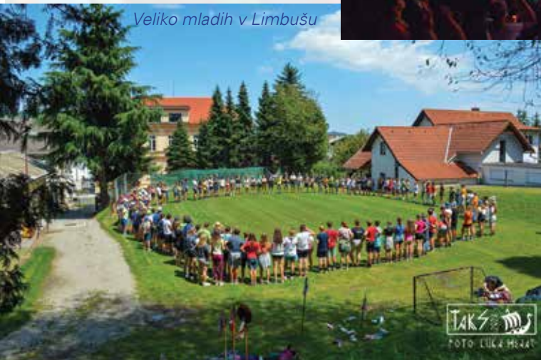
Veliko mladih v Limbušu

Žal pa je bilo lansko poletje zaznamovano s številnimi neurji, ki so povzročala škodo ne samo po domovih, poljih in v prometu, temveč tudi onemogočala varno taborjenje na prostem, prav tako pa je bila poškodovana taborna oprema. Tako je bila s strani vodstva tabora sprejeta odločitev, da se lokacija v luči dogodkov in vremenskih napovedi preseli nekam pod streho. Tu se je izkazala pripravljenost in dobrotu tudi s strani OŠ Rada Robiča Limbuš ter limbuške župnije. Udeležence so tako z avtobusi preselili v Limbuš, kjer so zadnja dva dni tabora v lanskem juliju preživeli v prostorih šolske telovadnice in okolici šole. Mimoidoči so tako lahko videli kupe skavtov z ruticami v barvah svojih domačih krajev, od modro-rumeno-rjave Maribora 2, pod katerega okoliš spada Limbuš, modro-zeleno-bele Maribora 1, do rutic Slovenske Bistrice, Celja, Koroške 1 in 2, Črenšovcev, Mozirja itd.