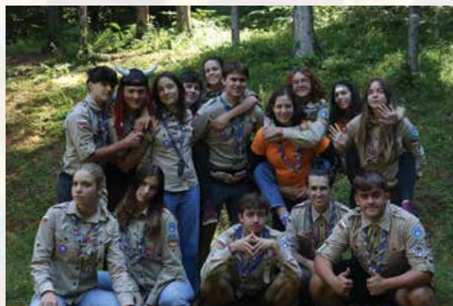
Taborniki - popotniki

Del taborništva pa so tudi večje akcije, ki obsegajo več ko samo naše področje, ampak tudi Evropo in celoten svet. Nekaj naših tabornikov je letošnje poletje imelo izkušnjo doživeti takšno akcijo Roverway 2024 na Norveški, t.j. mednarodno srečanje tabornikov. Skupaj so se najprej podali na potovanje do Stavangerja. Njihove postajanke na tej poti so bila mesta kot Berlin, Kopenhagen, Oslo. Pot pa jih je najprej vodila na nekaj dnevni bivak v Ingelsrud. Njihova končna destinacija je bilo obalno mestece Stavanger, kjer so se priključili glavnemu taboru z 6000 udeleženci. Nepozabno doživetje!