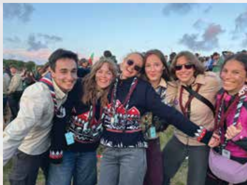
Na evropskem jamboreeju na Norveškem

dan v naravi parka Tivoli. Seveda, pa se tukaj naš seznam akcij ne konča.