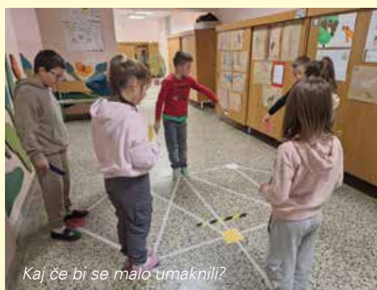
Kaj če bi se malo umaknili?