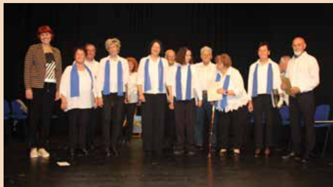
MPZ DU Li-Pe, dobitniki Galusovih značk