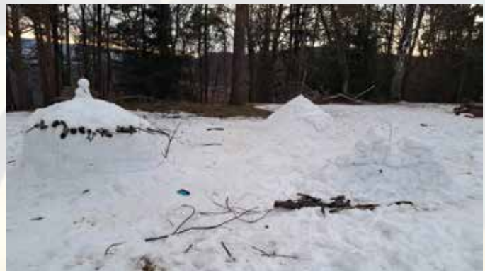
Igluji na zimovanju