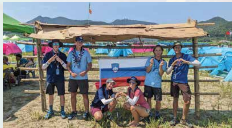
Jamboree 2023 v Južni Koreji