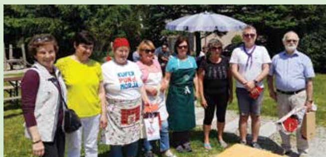
Kuhanje »kisle župe«