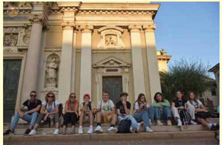
Učenci in učitelji na ogledu mesta Busto Arsizio

Kljub napornemu urniku s(m)o imeli vsi veliko energije, ohranili nasmeške na obrazih, stkali nove vezi in pridobili ogromno izkušenj. Potovali smo, se povezovali, spoznavali, odkrivali, dobivali nove izkušnje, preizkusili nasvete drugih, usvajali nove spretnosti ... Toliko pozitivnih izkušenj, da bi privoščili vsakemu učitelju in učencu, da doživi kaj podobnega.