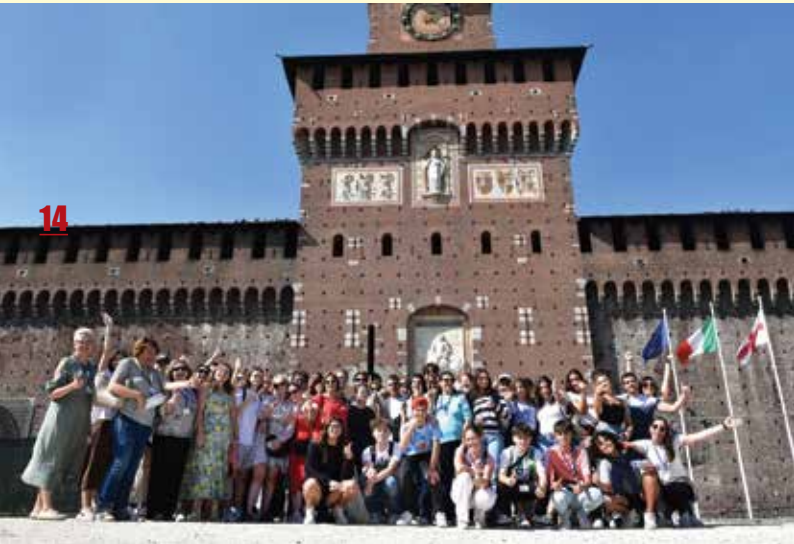
Vseh pet delagacij na potepu (Slovenija, Španija, Finska, Litva, Italija)

V Milanu sem se zelo zabavala. To je bila izkušnja, ki jo želim podoživeti vsaj še enkrat. Celotno potovanje je bilo super in težko je izbrati med vsemi temi lepimi trenutki. Ampak po mojem mnenju je bila najboljša stvar zadnja zabava. Ker smo se malo že poznali, smo se imeli priložnost pogovarjati več o drugih stvareh kot o debatnih temah. Hrana tam je bila res dobra. Všeč mi je bilo, ker je imela vsaka država svojo podeželsko hrano. Naučila sem se, kako v resnici poteka debata. Moja angleščina se je izboljšala. Naučila sem se tudi, kako biti samozavestnejša, saj sem morala govoriti pred veliko ljudmi. Naši učitelji so nam tudi pokazali, kako biti iznajdljivi, ko je bil naš let opovedan.