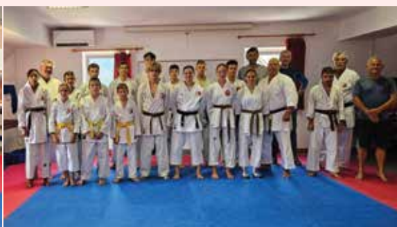
Seminar v Bovcu