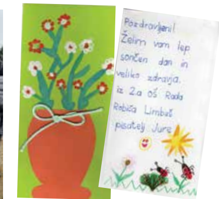
voščinica učencev starejšim