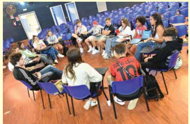
Učenci naše šole debatirajo s Španci

Moja izkušnja v Milanu je bila nekaj, česar ne bom nikoli pozabil. Imeli smo veliko zabave in lepih trenutkov, a tisti, ki ga ne bom nikoli pozabil, je srečanje s starim prijateljem iz zadnje izmenjave. Bila je čista sreča, ko sem ga videl po tako dolgem času in res lahko rečem, da sem tukaj pridobil veliko prijateljev. Moja angleščina se je od začetka projekta zelo izboljšala. Veliko samozavestneje govorim v tujih jezikih in na splošno sem prenehal uporabljati mašila, kot je "uh". To bi res priporočal vsem, ker se naučiš veliko o kulturi po vsem svetu, pridobiš veliko novih prijateljev, izboljšaš se v govorjenju angleščine in očitno se izboljšaš v debatiranju na splošno. Kot sem že omenil, sem se veliko naučil, nekaj, kar pa res še posebej cenim, so različne perspektive in to, kako ljudje drugače gledamo na svet v primerjavi z nami, Slovenci.