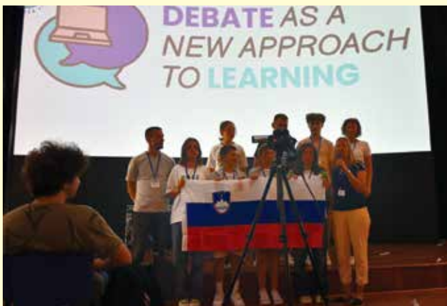
Predstavitelj OŠ Rada Robiča Limbuš, Maribora in Slovenije

Na Erasmus izmenjavi v Milanu sem doživela neverjetno izkušnjo. Ne samo, da sem izboljšala svojo angleščino, ampak sem tudi spoznala veliko novih, čudovitih ljudi iz drugih držav. Najbolj nepozaben trenutek pa je bil zadnji dan - poslovilna zabava. Plesali smo in se zelo zabavali in to je bila najboljša zabava v zadnjem času. Eden od vrhuncev je bilo sodelovanje v debatah, kjer sem se naučila umetnosti izražanja svojih idej in svojega mnenja. To potovanje toplo priporočam svojim sošolcem, saj je fantastičen način za razširitev jezikovnih veščin, sprejemanje različnih kultur in razvoj kritičnega mišljenja. Tudi o debati sem se veliko naučila. To so življenjske veščine, ki jih je, po mojem mnenju, pomembno poznati. Res je bila nepozabna izkušnja in zapomnila si jo bom za vedno.