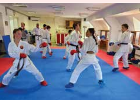
Karate kamp Bovec

Jeseni, z začetkom šolskega leta, smo na OŠ Rada Robiča imeli znova predstavitev karateja in demon-