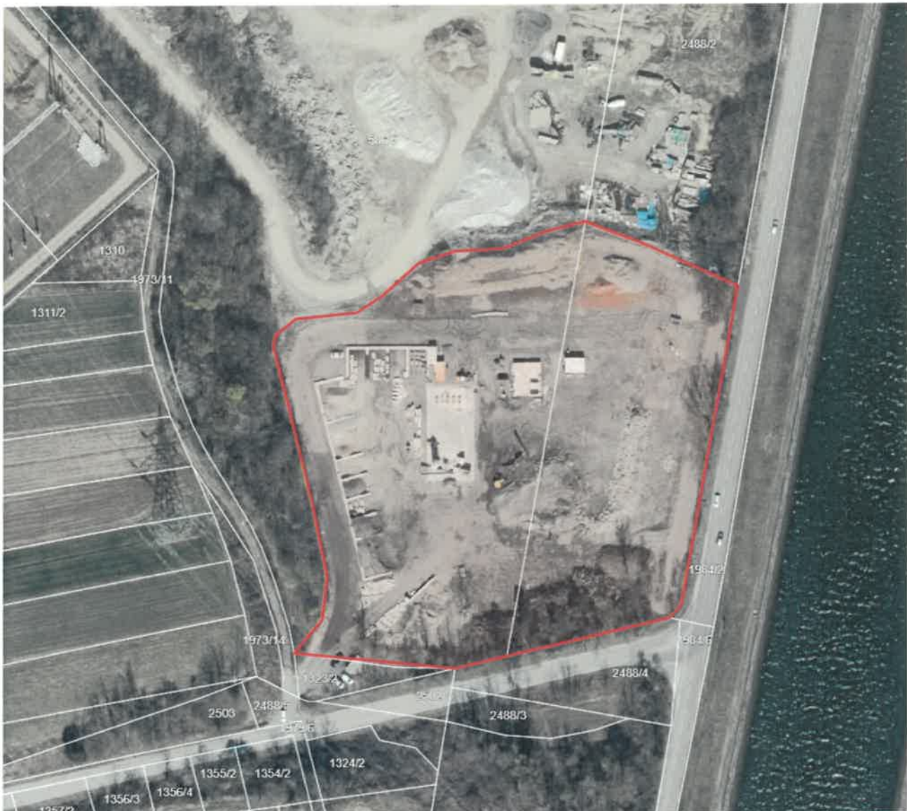
Slika 1: Trenutni prostorski obseg izvajanja dejavnosti