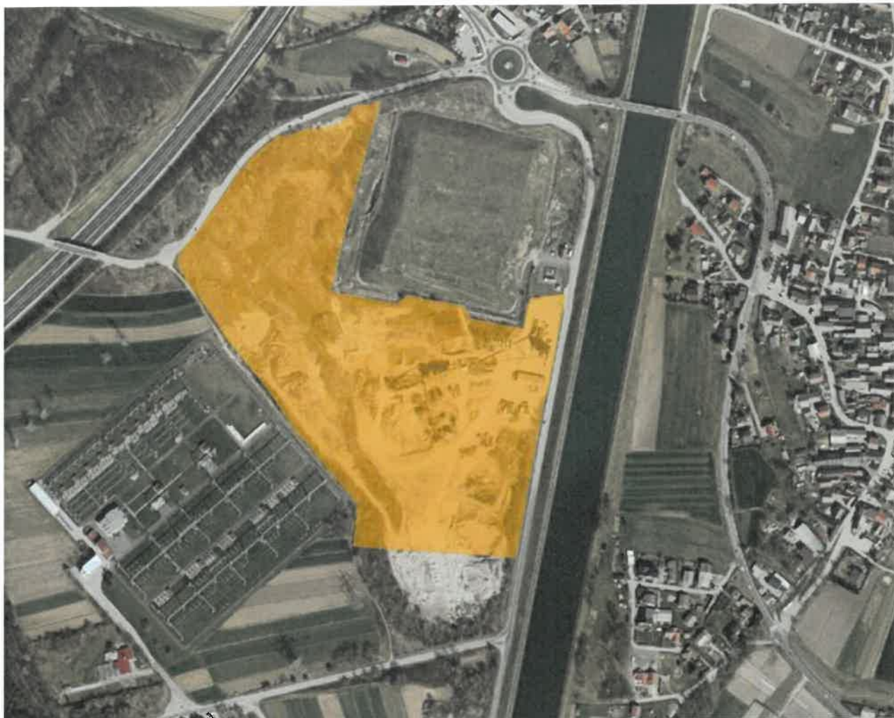
Slika 3: Predvideno območje za nadomeščanje kmetijskih zemljišč na območju Dogoš