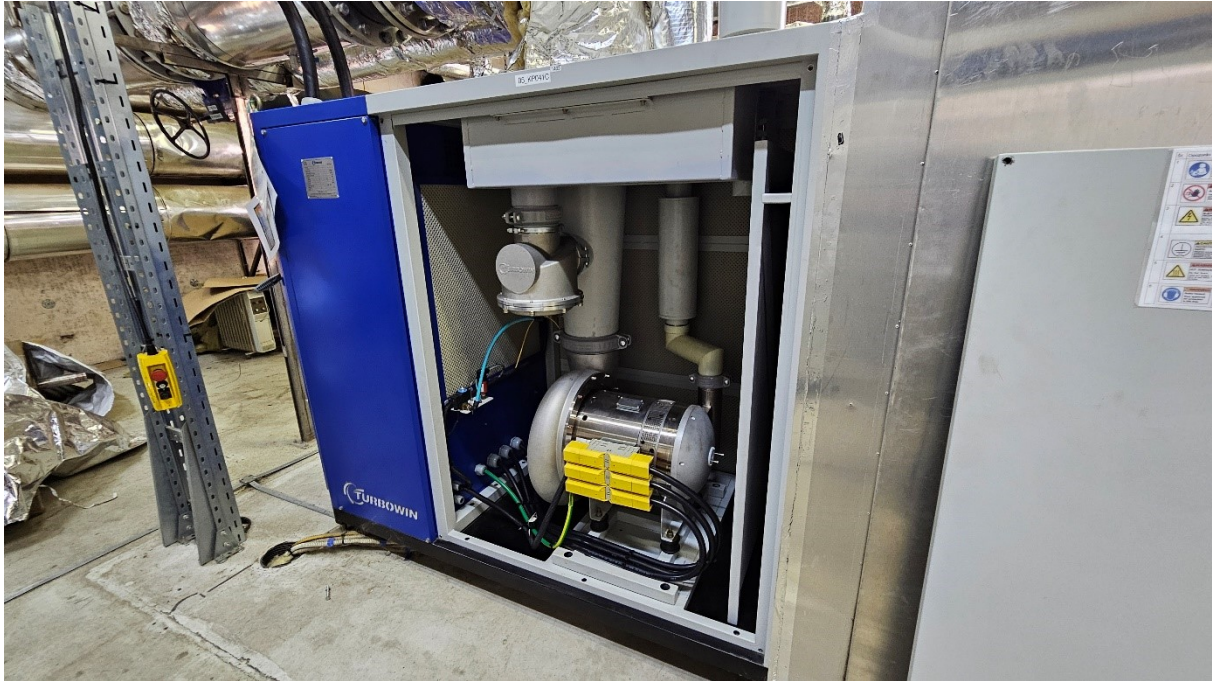
Slika 2: odprto ohišje puhal.