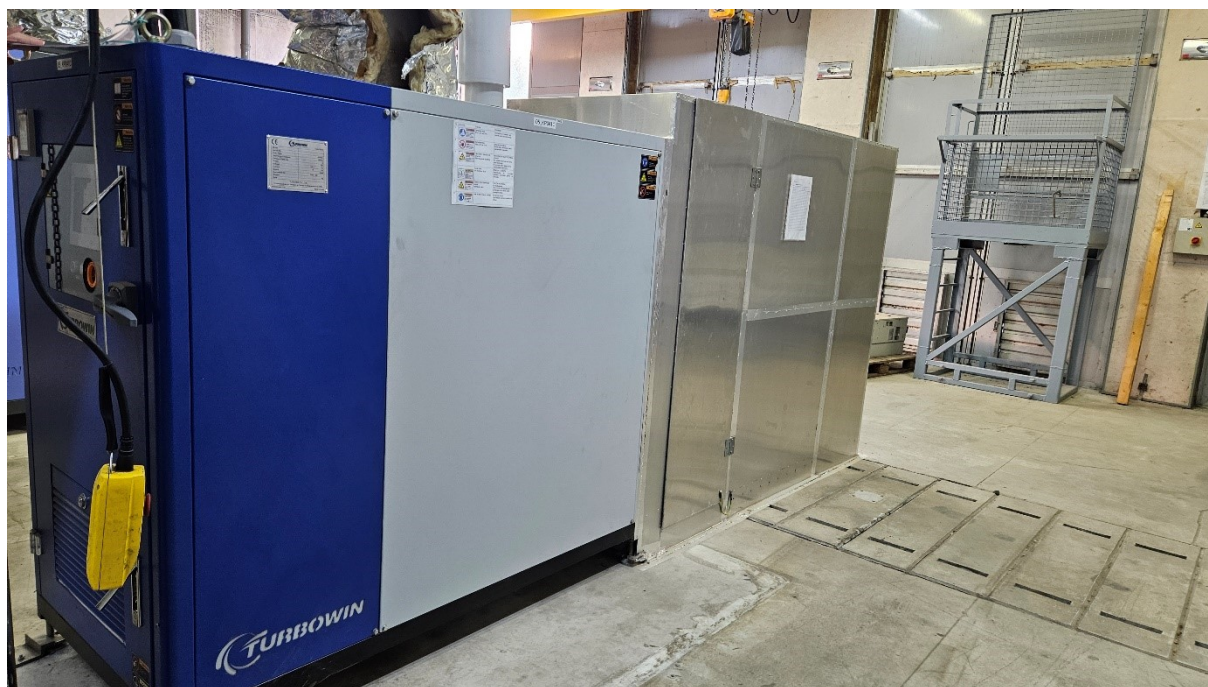
Slika 1: zaprto ohišje puhal.

Na fotografijah je prikazano stanje puhal ob prevzemu CČN, iz katerih je razvidno, da so bila puhala z elektromotorji v dobrem funkcionalnem stanju.