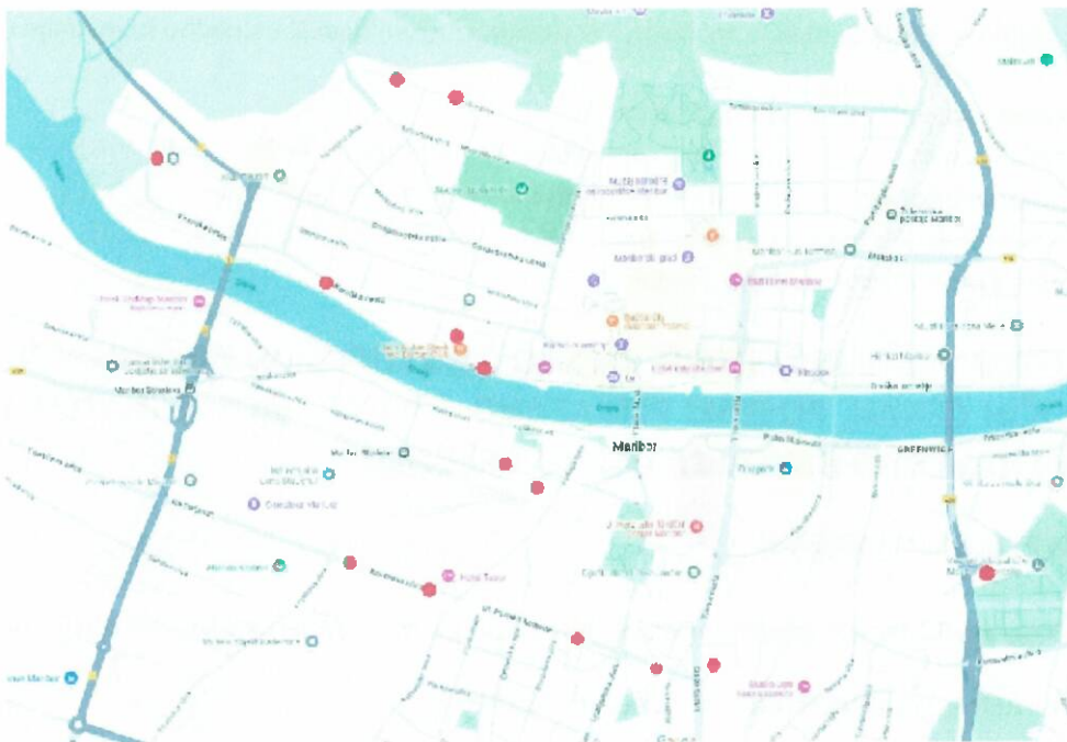
SLIKA 2: Lokacije parkomatov - (rdeče pike)

V nadaljevanju je prikazan programski projekt z oceno vrednosti vlaganja za leto 2024.