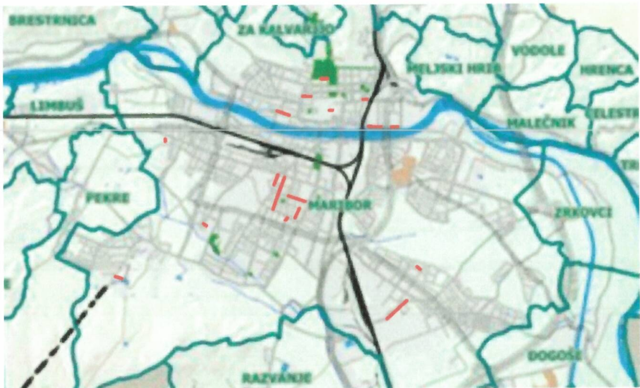
SLIKA 2: Lokacije nadomestnih zasaditev dreves – jesen 2024 - (rdeče linije)

Kar znese skupaj za 120 dreves 69.600,00 EUR