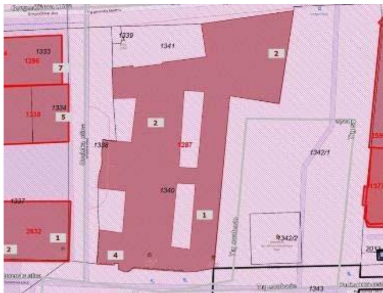
Slika 5: Parcela št. 1340 in grad - stavba št. 1287