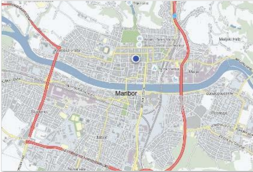
Slika 3: Umestitev načrtovane naložbe v mestu Maribor

Loretska kapela je sestavni del mariborskega gradu. Mariborski grad stoji v srednjeveškem delu mesta na levem bregu Drave, ob robu nekdanjega obzidja mesta: