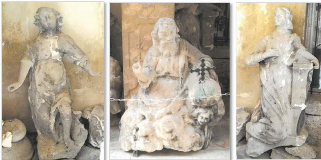
Slika 2: Trije kipi, ki so bili nameščeni nad vhodom v loretsko kapelo

Vir: Restavratorski center ZVKDS, september 2024