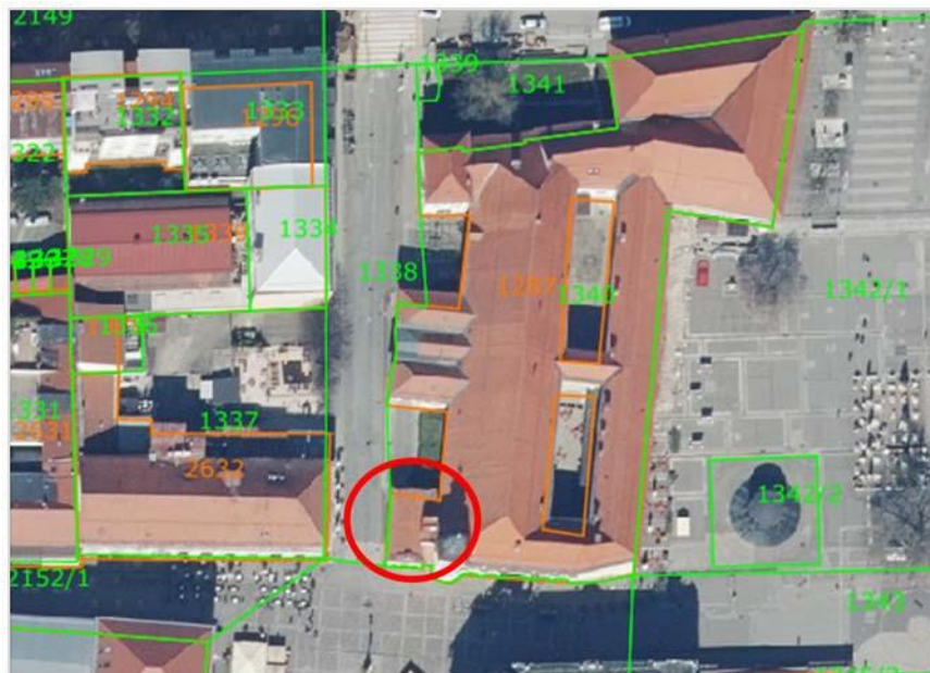
Slika 4: Loretska kapela stoji na jugozahodnem robu mariborskega gradu