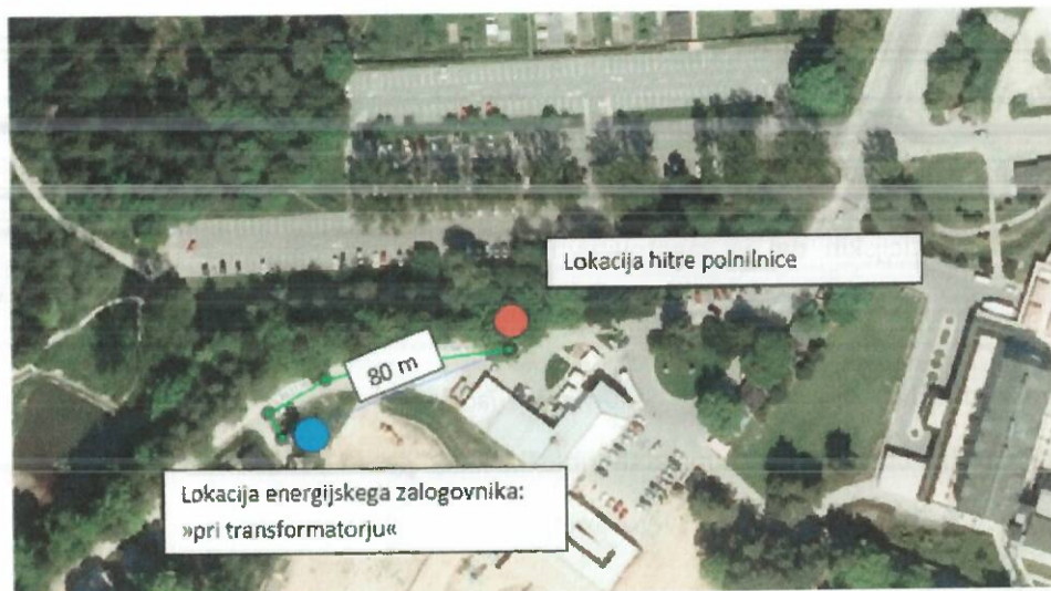
Slika 2-3: Prikaz potencialnih lokacij za energijski zalogovnik.