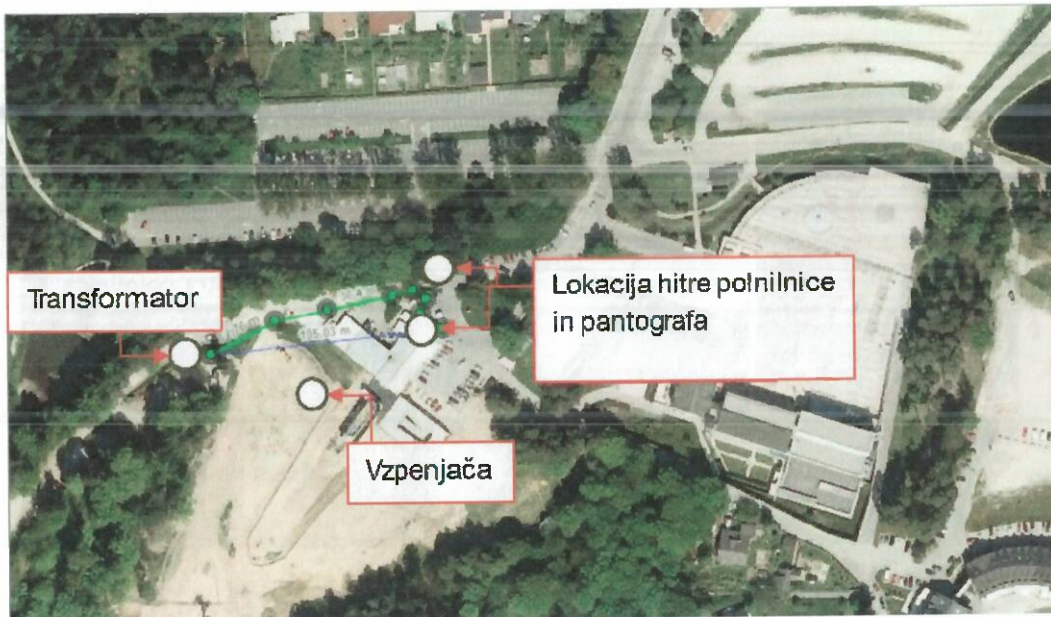
Slika 2-1: Situacija obstoječega stanja – polnilnica za priložnostno polnjenje e-busov na Vzpenjači.