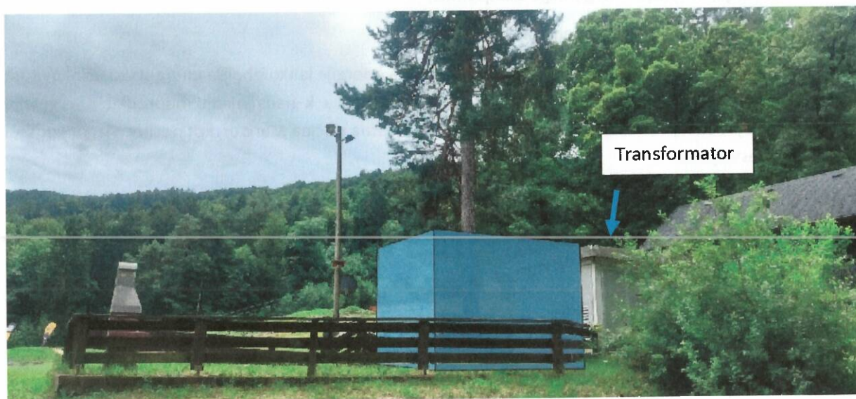
Slika 2-4: Umestitev energijskega zalogovnika v prostor.