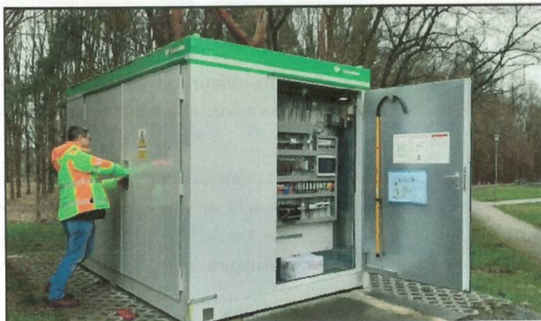
Slika 4-2: Primer izvedbe energijski zalogovnik (Plzen, Češka).