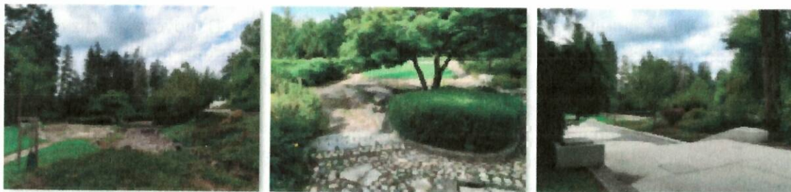
Slika 1: Pogled na območje japonskega vrta na SZ delu Mestnega parka