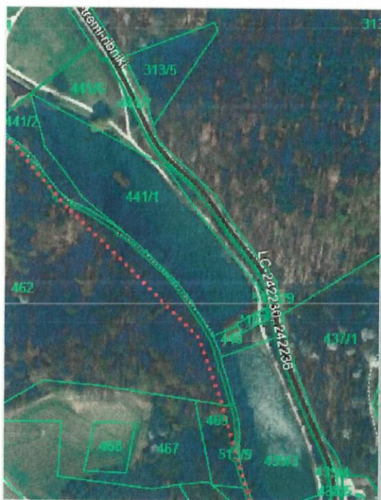
Slika 6: Območje sanacije ribnikov in brežin

Območje sanacije vodnih površin in brežin ribnikov zajema parcele: 312/21, 312/22, 313/5, 438/4 (del), 439/3, 440, 441/1, 441/2 in 441/6 (del), vse k. o. 638 Krčevina.