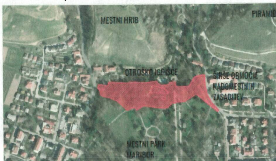
Slika 4: Območje nadomestne sadnje v severnem delu parka