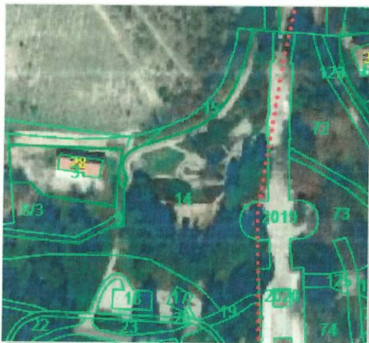
Slika 5: Območje posega – ureditev japonskega vrta