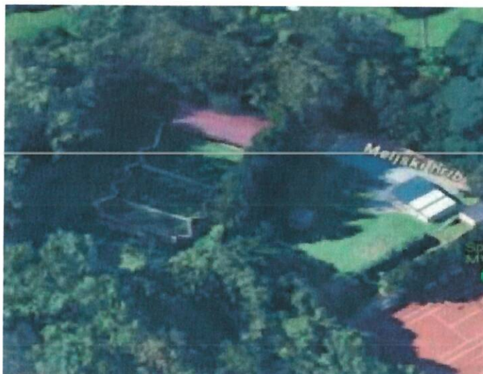
Slika 2: strelišče Melje https://www.easistent.com/nibsos/jaz