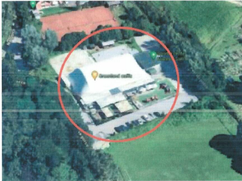
Slika 3: nogometni center Marinko Galič