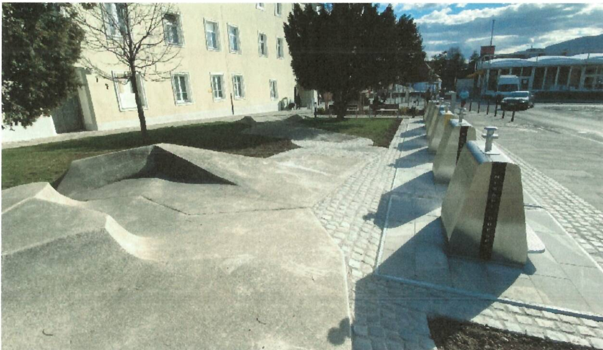
SLIKA: novo stanje 2023

V letu 2020, je na lokaciji Koroška cesta/Strossmayerjeva obstoječa lokacija smetarnikov, kjer se je skupno nahajalo 7 zabojnikov za smeti, nadomestilo z novim sistemom podzemnih smetarnikov za ločeno zbiranje odpadkov. Lokacija je bila izbrana na podlagi izhodišča, da je na isti lokaciji že bil vzpostavljen ekološki otok, območje se je v sklopu prenove Koroške ceste celovito prenavljalo. Mikrolokacija zdajšnje postavitve je bila glede na lokacije obstoječih podzemnih komunalnih vodov kot edina možna, določena ob lokaciji Forma vive.