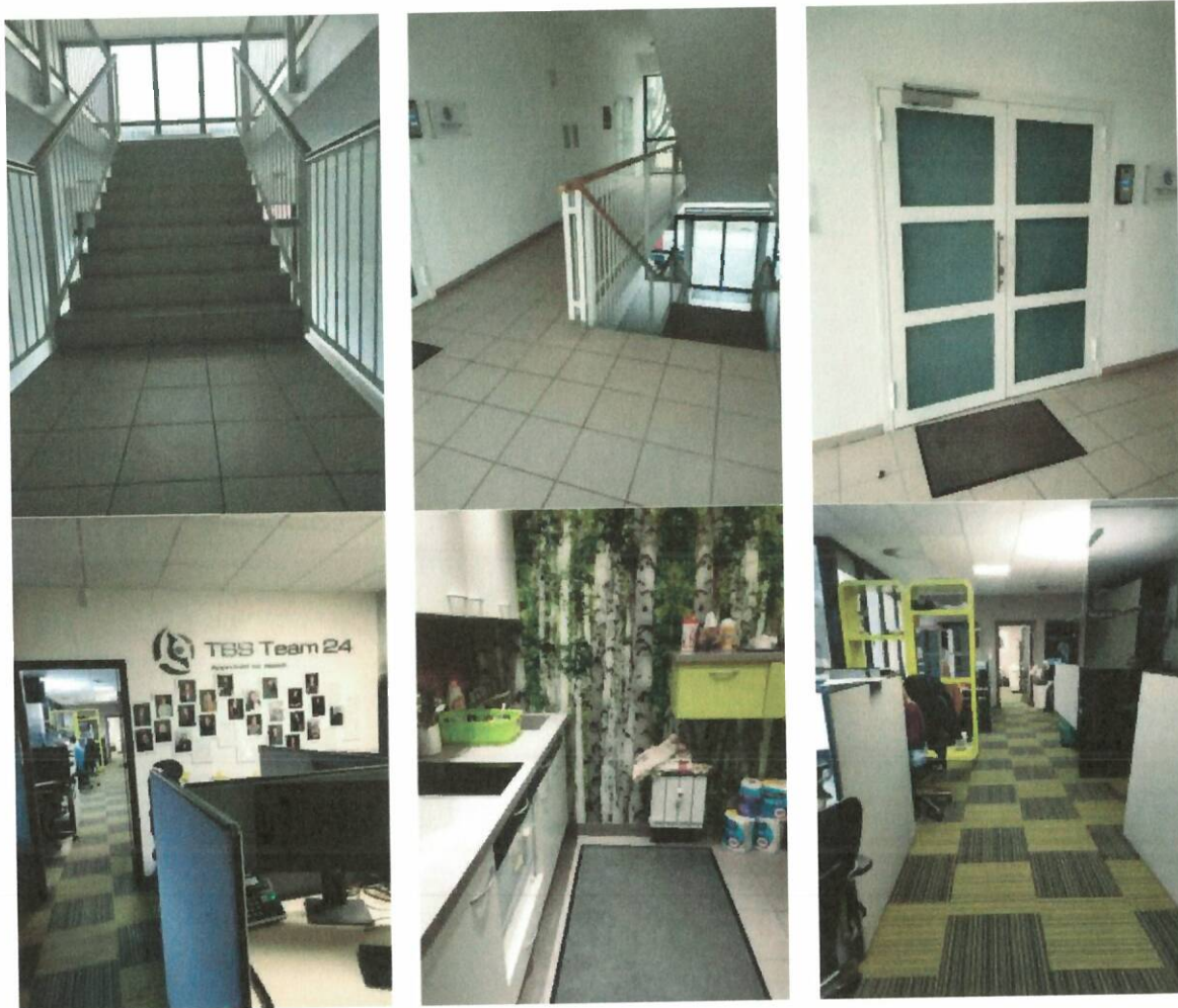
SLIKA 5: Slike poslovnega prostora na Ljubljanski ulici 42

Poslovni prostor se nahaja v prvem nadstropju objekta, ki je bil izgrajen leta 2000. Prostor obsega sprejem, operativo, sejno sobo, server sobo, čajno kuhinjo in sanitarije. Stene so finalno obdelane, pleskane. Na tleh je tekstilna talna obloga. Okna so v alu okvirjih. Vhodna vrata so protivlomna, notranja steklena. Ogrevanje je daljinsko toplovodno (Energetika Maribor) na radiatorje. Stropi so spuščeni z vgrajenim prezračevalnim sistemom in svetili. Poslovni prostor je bil leta 2015/2016 deležen adaptacije: zamenjava podov, novi spuščeni stropi (zvočno vpojni), vse inštalacije, mrežno OTP ožičenje, sanitarije, kuhinja + oprema.