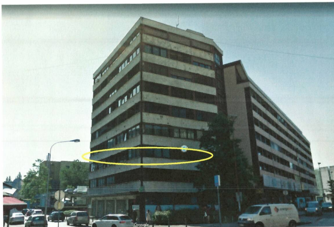
SLIKA 2: Stavba in pozicija poslovnega prostora na Ljubljanski ulici 9

V prostorih deluje že od leta 1999 društvo Ozara Slovenija, Nacionalno združenje za kakovost življenja, ki je nevladna, humanitarna organizacija, ki deluje v javnem interesu na področju socialnega in zdravstvenega varstva. Z različnimi programi zagotavlja strokovno pomoč in podporo ljudem z dolgotrajnimi težavami v duševnem zdravju, ljudem v duševni stiski in njihovim svojcem, poleg tega pa namenjajo skrb še ohranjanju in izboljšanju duševnega zdravja vseh prebivalcev in prebivalk v R Slovenije. Ozara ima svoj sedež v predmetnem poslovnem prostoru, svojo dejavnost pa izvaja v 27. krajih širom Slovenije. Društvo se je tekom delovanja soočalo z številnimi okvarami povezanimi z dotrajano opremo (elektroinstalacije, podi, fasadni elementi...), ki so jih sproti začasno tekoče sanirali in na ta način omogočali nadaljnjo delovanje.