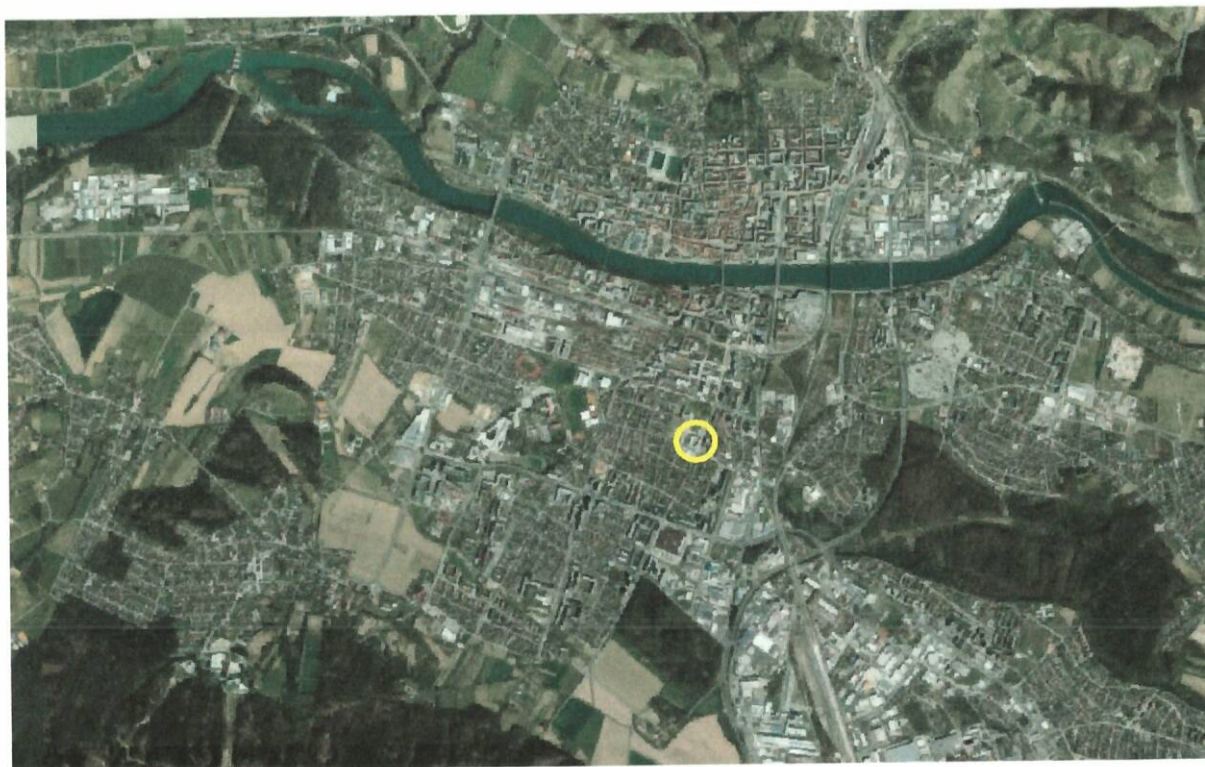
SLIKA 6: Lokacija predvidene investicije s prikazom širše okolice

Ulična razsvetljava je urejena. Parkirni prostori na ocenjevano lokacijo se nahajajo za objektom (rampa). Urbanistični predpisi ocenjevane nepremičninske posesti in okolice dovoljujejo uporabo za poslovno stanovanjsko dejavnost.