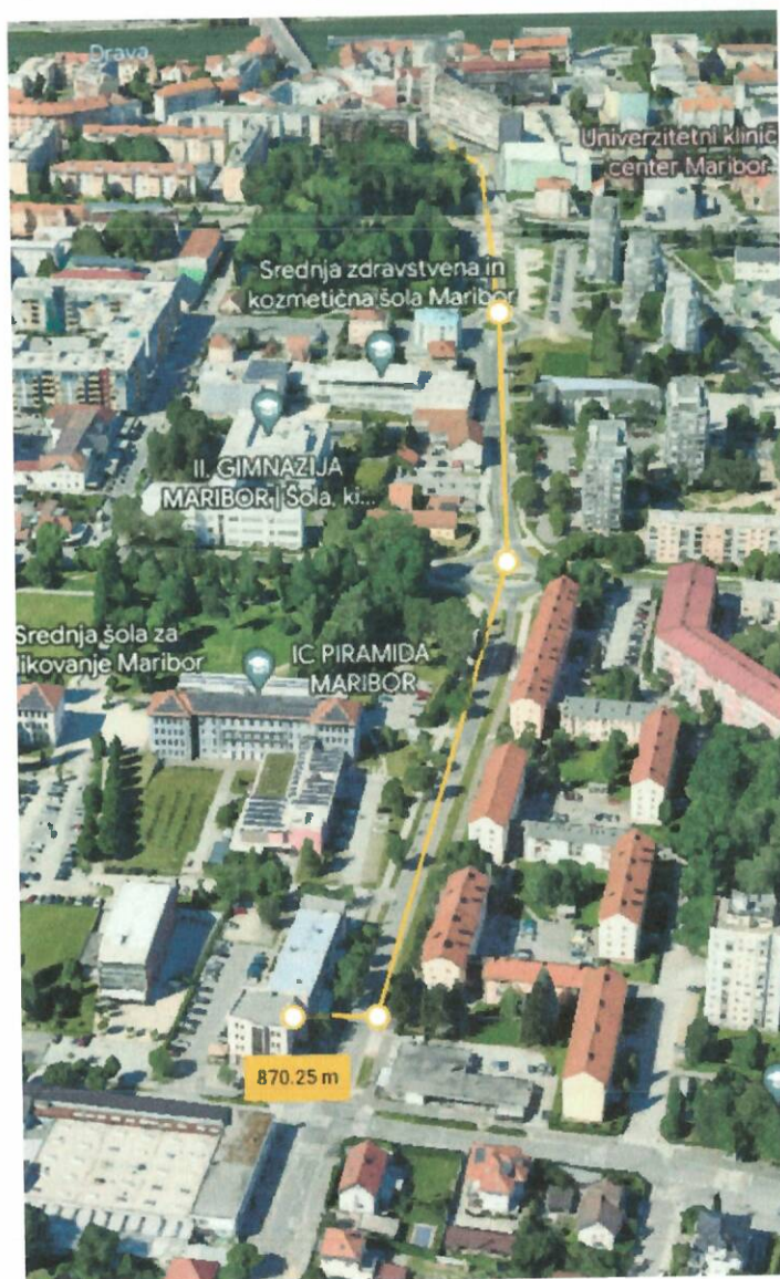
SLIKA 4: Razdalja med staro in novo lokacijo

Z investicijo bi Mestna občina Maribor dosegla zagotovitev ustreznih nadomestnih prostorov za izvajanje storitev socialnega in zdravstvenega programa v Mestni občini Maribor, saj je obstoječi poslovni prostor na Ljubljanski ulici 9 zaradi slabega stanja in tozadevno velikega in s tem nesorazmerno velikega stroška odprodan.