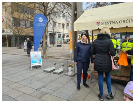
Fotografije: demonstracijska naprava AVP SPV