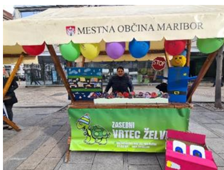
Fotografiji : izdelki otrok vrtca Studenci, Borisa Pečeta in Želvica

Na stojnici Javne agencije RS za varnost prometa, Sveta za preventivo in vzgojo v cestnem prometu so si udeleženci prireditve ogledali in preizkusili demonstracijske naprave - tehtnice za prikaz naletne teže. Med udeležence je bil zadeljen tudi preventivni material v okviru projekta Pasavček.