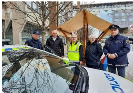
Fotografije: predstavitev dela policista

Na prireditvenem prostoru se je predstavila tudi Služba nujne medicinske pomoči. Otroci so si ogledali reševalno vozilo. Reševalec pa jim je predstavil svoje delo.