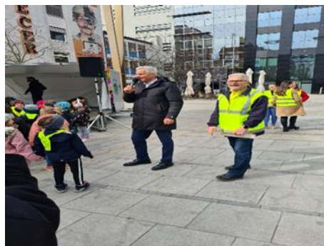
Fotografiji: uvodni pozdrav župana in predsednika SPV