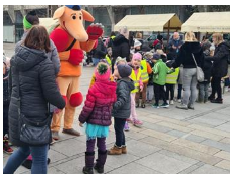
Fotografije: srečanje z maskoto Pasavčka