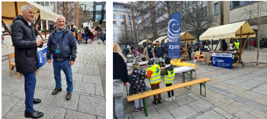
Fotografije: Otroci v tematski delavnici Zveze prijateljev mladine Maribor

Na tematski ustvarjalni delavnici Zveze prijateljev mladine so otroci barvali in izdelovali lik Pasavčka.