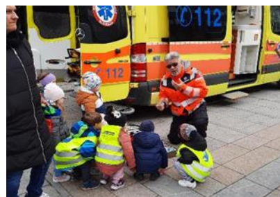
Fotografije: predstavitev dela in opreme reševalca