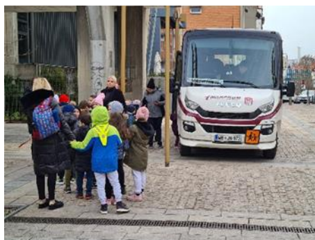
Fotografije: demonstracija varne vožnje z avtobusom