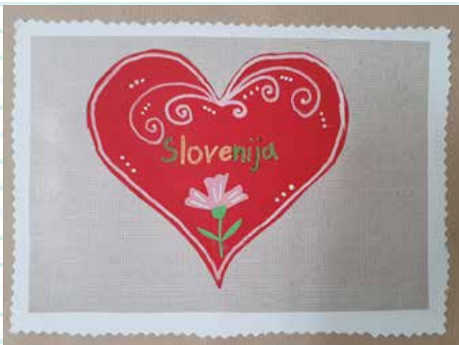
Zoja Pirc 4. b 7. a: Moja Slovenija (likovni natečaj)