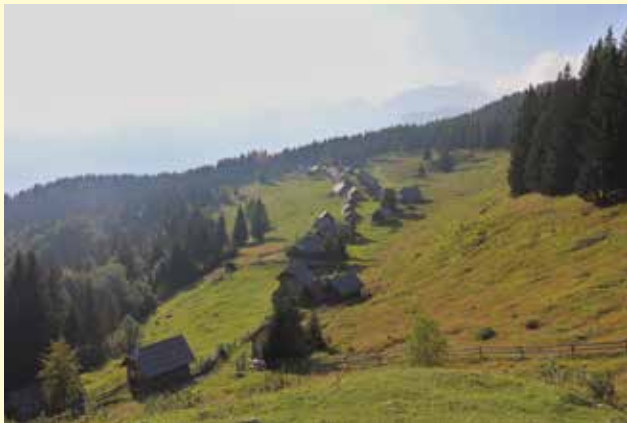
Jernej Čarman Planina Zajamniki (fotonatečaj)