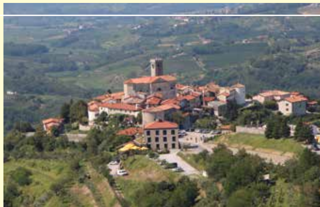
Neža Možic - Šmartno (fotonatečaj)

V državi se je javno življenje ponovno ustavilo od 1. do 11. 4. 2021 in pouk je za vse učence potekal na daljavo. Od 12. 4. 2021