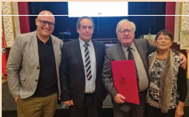
Vodstvo KD Pekre - Limbuš

Da bi nekako ohranjali vezi s publiko, smo se spet aktivirali na družbenem omrežju. Že predvajanim predstavam na Youtube kanalu (Štajerc v Ljubljani, Da te kap, Politika, bolezen moja in Gospa poslančeva) se je pridružila v decembru še predsta-