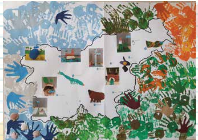
Skupinsko delo 1. a - Znamenitosti Slovenije (likovni natečaj)