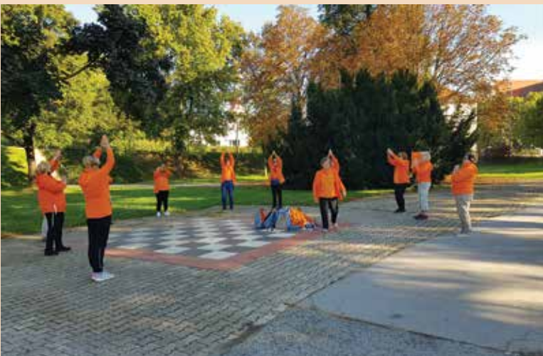
Po prihodu v Ptuj smo izvedli telovadbo v mestnem parku