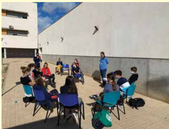
Uvodne debatne delavnice s španskimi osnovnošolci

Ker na šoli že nekaj let vzgajamo debaterje, smo bili povabljeni k projektu Erasmus+ Debating as a New Approach to Learning . Projekt bo trajal do jeseni 2023 in se ne ukvarja s tekmovalno debato, ki jo prakticiramo pri interesni dejavnosti, temveč z uvajanjem debatne metode v proces poučevanja. Metodo debatiranja bi gotovo lahko uporabili pri različnih predmetih v šoli in s tem učenje naredili zabavnejše in aktivnejše za učence. Cilj projekta je izdelati priročnike za učitelje in učence, ki bi tako učenje olajšali. V projektu sodelujejo tri nacionalne debatne organizacije: italijanska SNDI, španska FE Activa-T in slovenski zavod Za in proti. Implementacijsko platformo konzorcija predstavljamo šole: osnovna šola Colegio Miral-