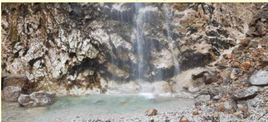
Minka Ela Šauperl - Slap Rinka

V mesecu septembru smo nameravali izvesti šolo v naravi za učence 5. razreda, a smo jo zaradi predvidevanja, da to ne bo možno, že takoj v začetku leta prestavili v mesec junij. Takrat smo jo uspešno, ob upoštevanju vseh omejitev, izvedli. Ostalih šol v naravi zaradi epidemije, žal, nismo mogli izvesti.