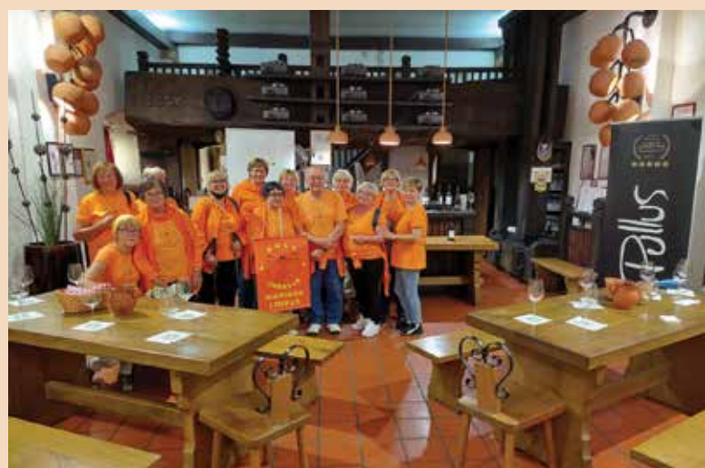
Šola zdravja Limbuš v vinski kleti v Ptuj