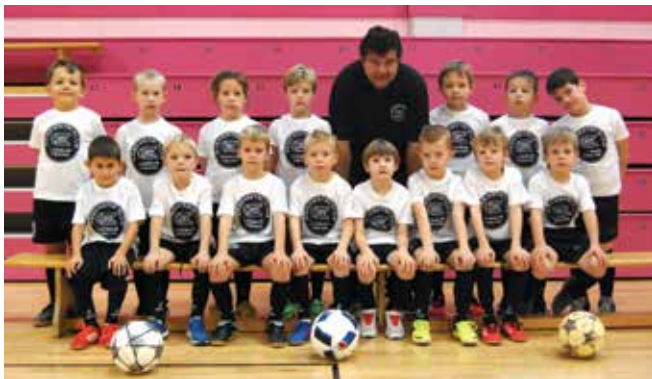
NK Limbuš - Pekre Marles hiše, mladi upi

Pozna se, da smo ustvarili stabilno sredino, v kateri svoje izkušnje nabirajo igralci iz domačega kraja in tudi iz širše okolice. V mlajših kategorijah imamo do 7. leta starosti vključenih v vadbo 20 igralcev, od 8. leta do 14. leta od 40 do 50 igralcev ter od 15. leta do 18. leta čez 30 igralcev, torej skupaj okrog 100 igralcev mlajših kategorij, ki nastopajo v šestih starostnih kategorijah v tekmovanjih MNZ Maribor. Med temi igralci so tudi dekleta, ki nabirajo izkušnje s svojimi vrstniki. Vodijo jih trenerji z dolgoletnim igralskim in trenerskim stažem in izkušnjami. Seveda pa ne gre brez pomoči staršev, ki se jim ob tej priložnosti zahvaljujem za njihov trud in pomoč pri delu posameznih ekip. Veteranska ekipa je prav tako zelo aktivna, sestavlja jo čez 20 igralcev, ki se družijo, igrajo in tudi tekmujejo s svojimi vrstniki, seveda po svojih močeh.