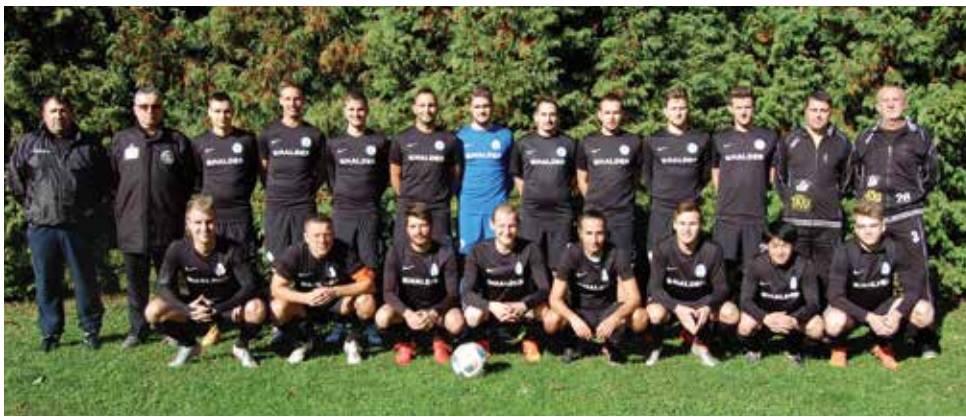
NK Limbuš - Pekre Marles hiše, člani