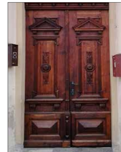
Vrata na Glasbeni šoli Ruše

vsako leto pripravimo tudi nekaj projektov. Tako smo že v letu 2009 skupaj s TD Studenci pripravili Gozdno lesarsko učno pot, še vedno je zelo odmeven junijski mednarodni Erasmus projekt POLETNA ŠOLA 2014 z udeležbo tridesetih študentov iz petih držav.