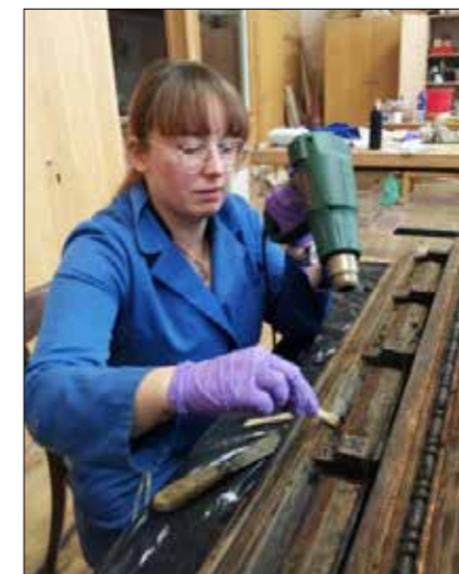
Študenti pri delu

LESARSKA ŠOLA MARIBOR ima dolgoletno tradicijo z več izobraževalnimi programi: od gozdarja, obdelovalca lesa, mizarja, lesarskega tehnika do inženirja lesarstva in oblikovanja materialov. Na Višjo strokovno šolo se vsako leto vpišejo bodoči študenti, ki so zaključili različne srednješolske in gimnazijske programe. Na programu »OBLIKOVANJE MATERIALOV« tudi v bodoče pričakujemo študente s talentom za dizajn ter s smislom za uporabo naravnih ter okolju prijaznih materialov, na programu »LESARSTVO« pa študente s prefinjenim občutkom za delo z lesom. Poleg rednega pedagoškega dela