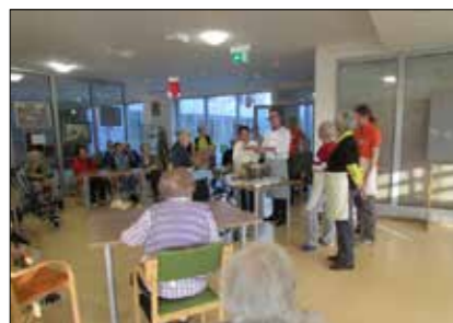
»Kuharska urica z direktorjem«