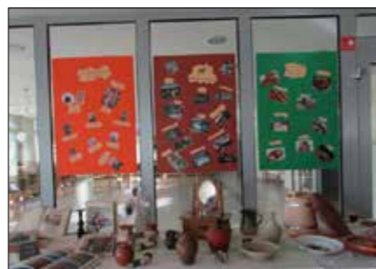
»Etno caffe: Dolenjska«